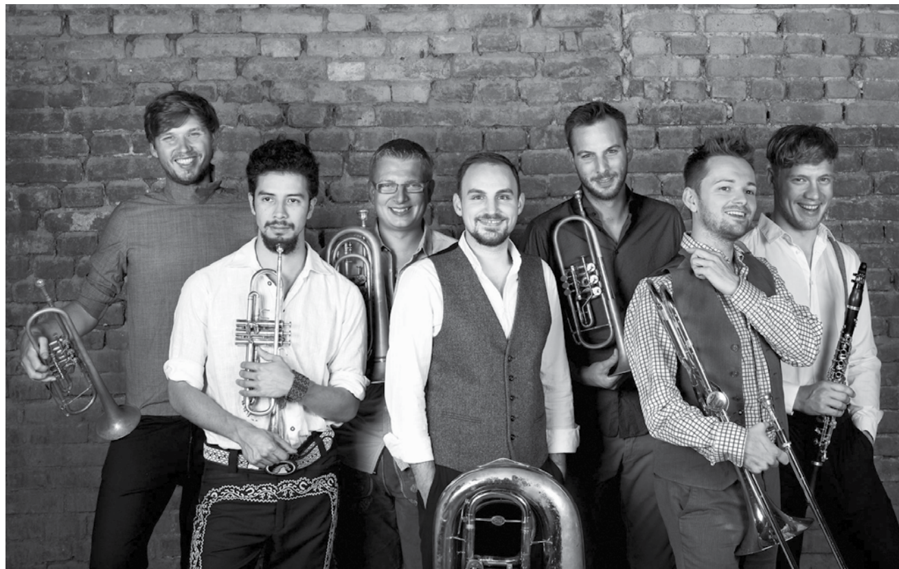
Blasmusik mal anders als im Musikantenstadl: Federspiel kommt an diesem Samstag, dem 30. Juni ins Cube 521 nach Marnach.

Queer Open Mic , poetry, drag, songs, spoken word, music, reading, theatre,