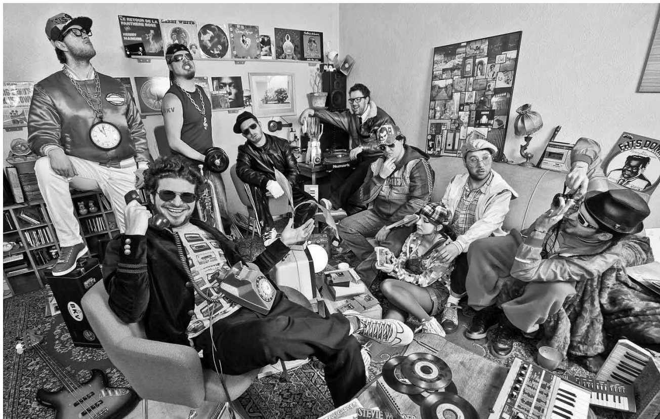
Quand le feu balkanique du Flying Orkestar rencontre les harmonies de la Weeltzer Musek, les étincelles volent - le 7 juillet à l'Amphitheater Wiltz.

Grand Théâtre, Luxembourg , 19h30. Tél. 47 08 95-1. www.lestheatres.lu