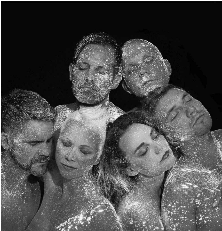
Ganz ohne Instrumente kommt das Ensemble Onair aus - am 8. Juli im Schlossgarten Saarbrücken.