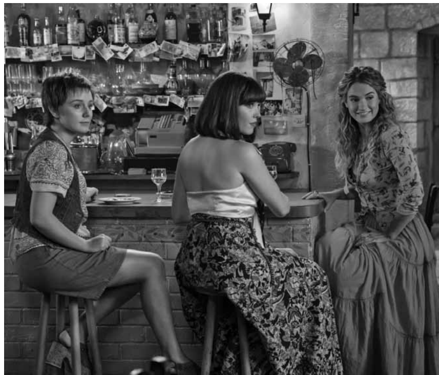
Sonne, Meer und ABBA-Ohrwürmer satt bietet die Fortsetzung des Kassenschlagers „Mamma Mia!“. „Mamma Mia! Here We Go Again“, neu in fast allen Sälen.

Trotz einiger Tragödien in der Vergangenheit führt die Familie Graham, bestehend aus Mutter Annie, ihrem Mann Steve und ihren beiden gemeinsamen Kindern Peter und Charlie, ein recht beschauliches Leben in einem abgelegenen Haus am Waldrand. Doch als Annes Mutter