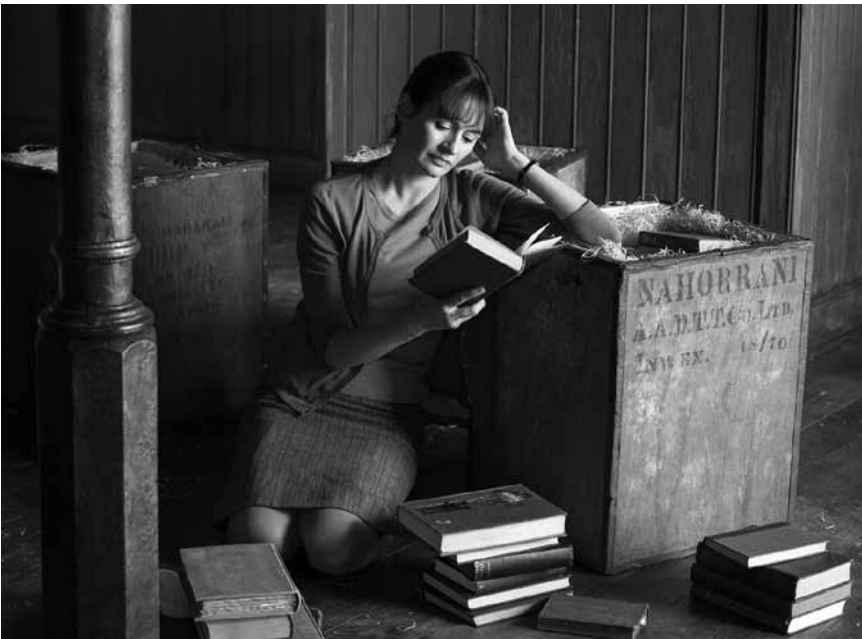
Pas facile d'ouvrir une librairie pour une jeune veuve, dans un village de la côte anglaise des années 1950 : « The Bookshop », nouveau à l'Utopia.

Liliane ist ein aufgewecktes junges Mädchen, das ihren Eltern aber immer wieder Sorgen bereitet. Die Kleine spricht nämlich mit Tieren und das führt dazu, dass die Familie stetig umziehen muss, weil Liliane mit ihren Tieren immer wieder für Ärger und Tumult sorgt.