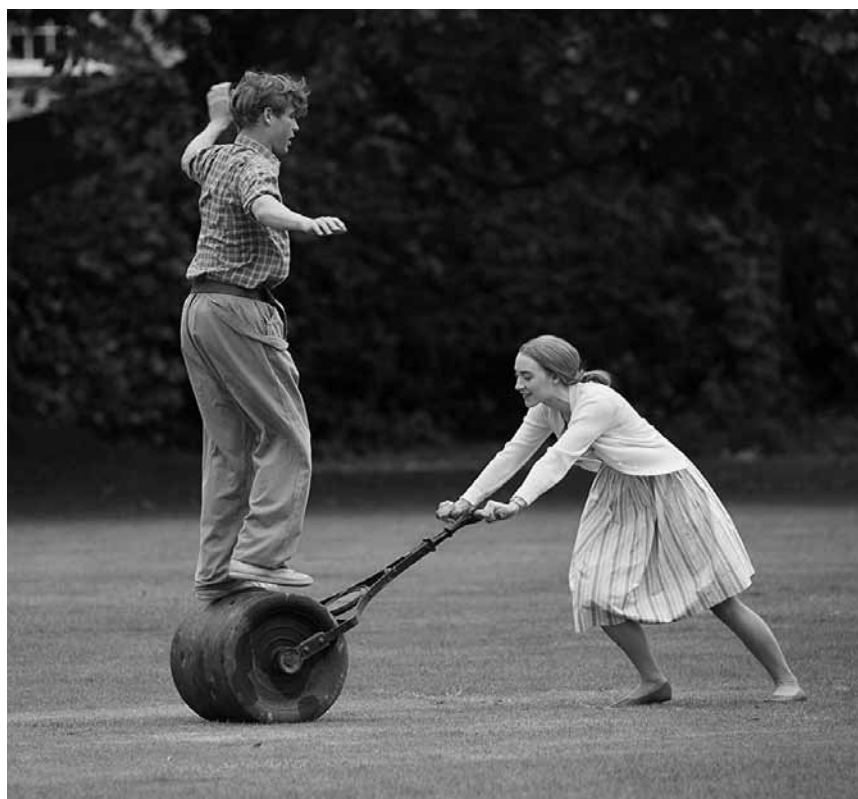
Eine Liebesgeschichte, die sich nicht über soziale Gräben und sexuelle Erwartungen hinwegsetzen kann: „On Chesil Beach“ – nach der Novelle von Ian McEwan, neu im Utopia.

✂ Une version féminine de la série aux vols impossibles ? Bonne idée. Mais Gary Ross n'a pas le flair de Steven Soderbergh : le film tire trop sur la corde de l'opposition entre féminin et masculin et ne retient de la leçon des précédents que ces séquences où préparatifs et action