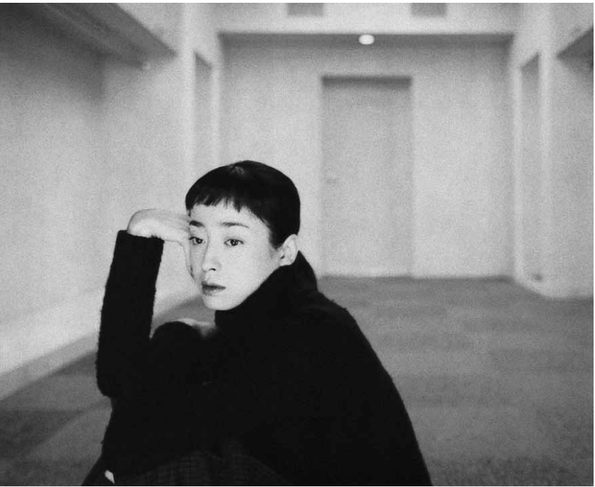
Eine Geschichte von sozialer und materieller Leere: „Tony Takitani“ – am 21. August in der Cinémathèque.

Sam treibt mit Freundlichkeit, aber auch recht ziellos durch sein Leben. Er verliebt sich in seine Nachbarin Sarah, die dann jedoch urplötzlich unter mysteriösen Umständen nicht mehr da ist. Die Polizei gibt nicht viel auf ihr Verschwinden und so wird Sam unfreiwillig selbst zum Detektiv, der Spuren und Hinweisen folgt, um herauszufinden, was aus ihr geworden ist.