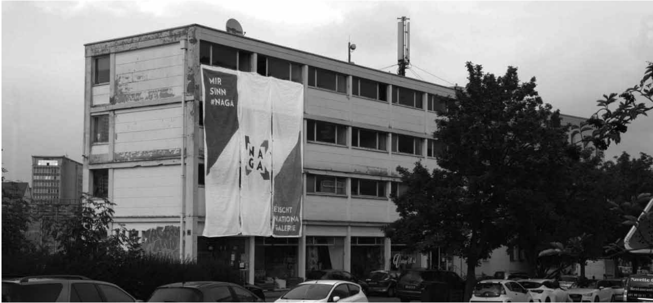
D'Richtung 22 weist dem Bettel mol wéi dat richteg geet mat der « Nationalgalerie » - vum 24. bis den 29. September am Hariko zu Bouneweg.