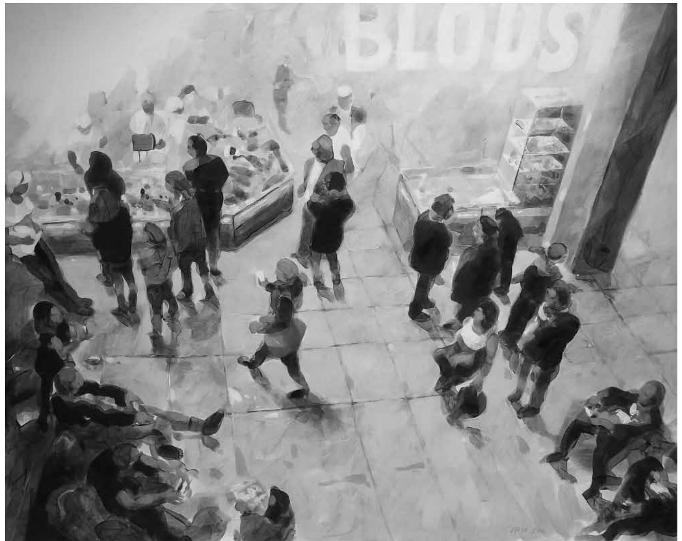
Der deutsche Maler Wolfgang Blanke greift gerne zu ungewöhnlichen Mitteln um sich auszudrücken - seine neuesten Bilder sind vom 23. September bis zum 19. Oktober in der Galerie Schortgen zu sehen.

NEW installation, Centre Pompidou-Metz (1 parvis des Droits-de-l'Homme.