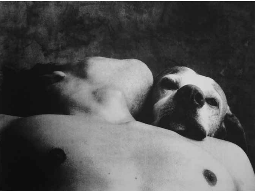
« Les corps impressionnés », de Jean Janssis, laisserent sûrement une impression durable - jusqu'au 7 octobre à l'espace Beau Site d'Arlon.

Sculptures de jardins - regards croisés sur les jardins de Versailles et du Grand-Château d'Ansembourg NEW photographies de Stéphane Dupaquier, château (10, rue de la Vallée), du 21.9 au 23.9, ve. - di. 11h - 18h.