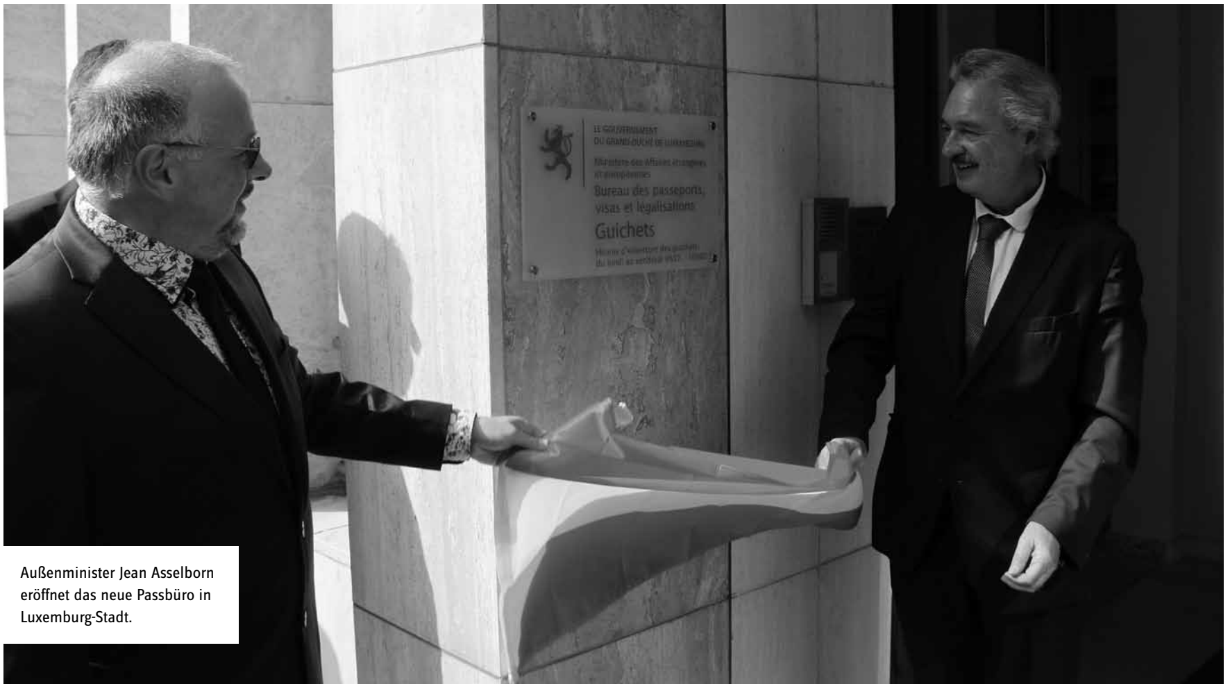
Außenminister Jean Asselborn eröffnet das neue Passbüro in Luxemburg-Stadt.