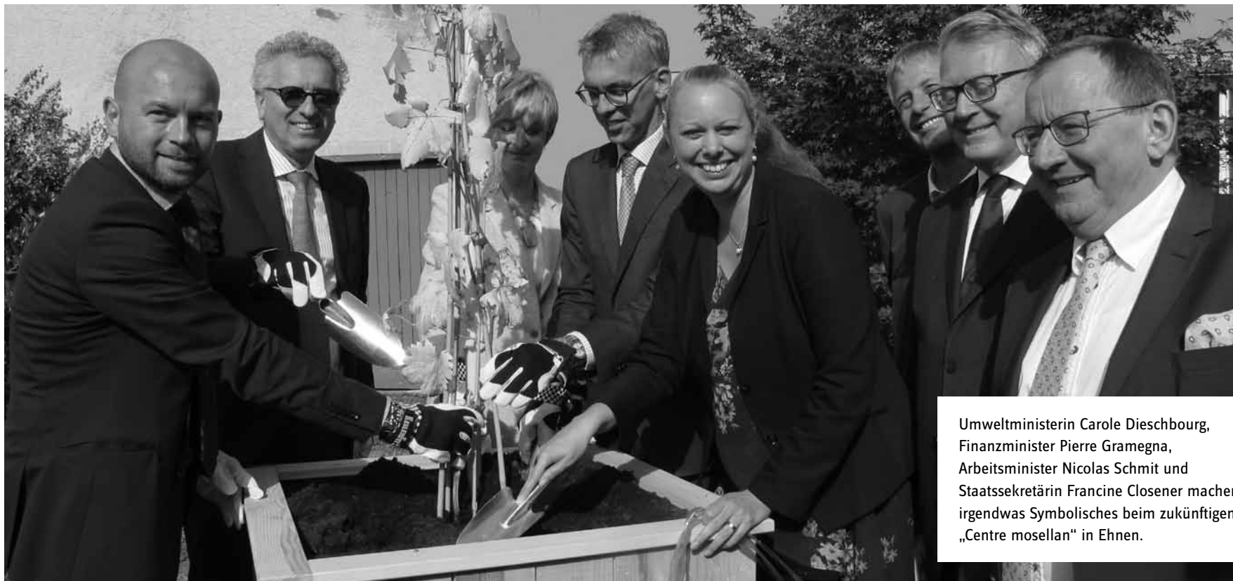
Umweltministerin Carole Dieschbourg, Finanzminister Pierre Gramegna, Arbeitsminister Nicolas Schmit und Staatssekretärin Francine Closener machen irgendwas Symbolisches beim zukünftigen „Centre mosellan“ in Ehenen.