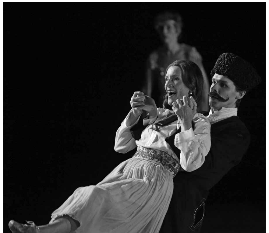
Liebe, Suppe und Kommunismus: In der Alten Feuerwache in Saarbrücken kommt Nino Haratischwilis Roman „Das achte Leben“ an diesem Freitag, dem 28. und an diesem Sonntag, dem 30. September sowie am 6. Oktober auf die Bühne.