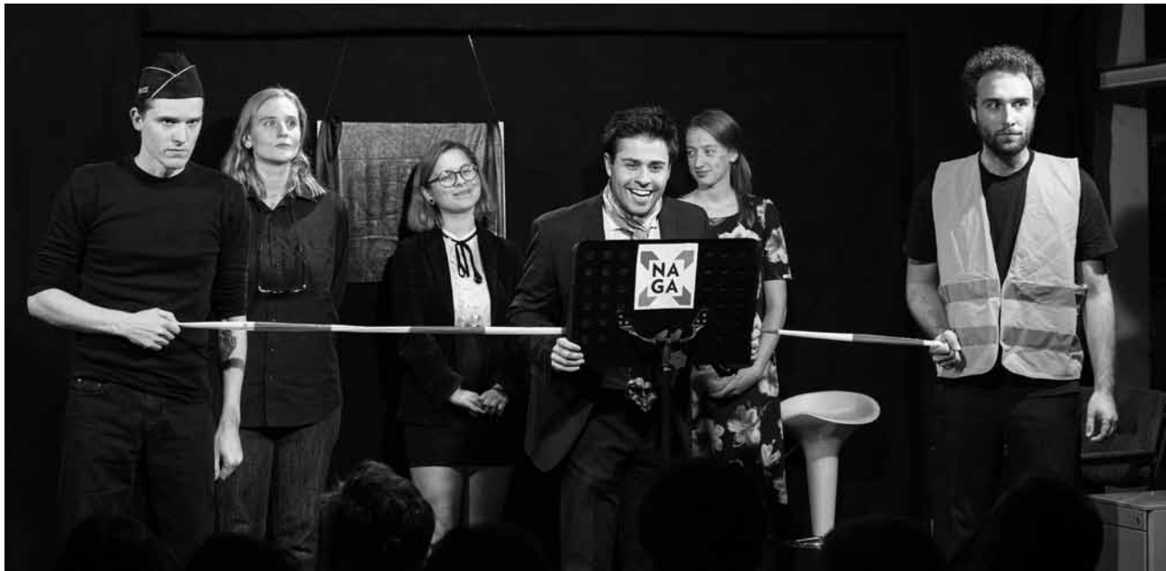
De Xav' kann endlech seng Nationalgalerie aweien.