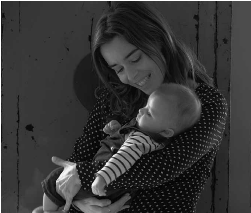
Les drames du quotidien derrière l'adoption sont révélés par « Pupille » - nouveau à l'Utopia.

Pettersson und Findus: Findus zieht um D 2018 von Ali Samadi Ahadi. Mit Stefan Kurt, Marianne Sägebrecth und Max Herbrechter. 81'. O.-Ton. Für alle.