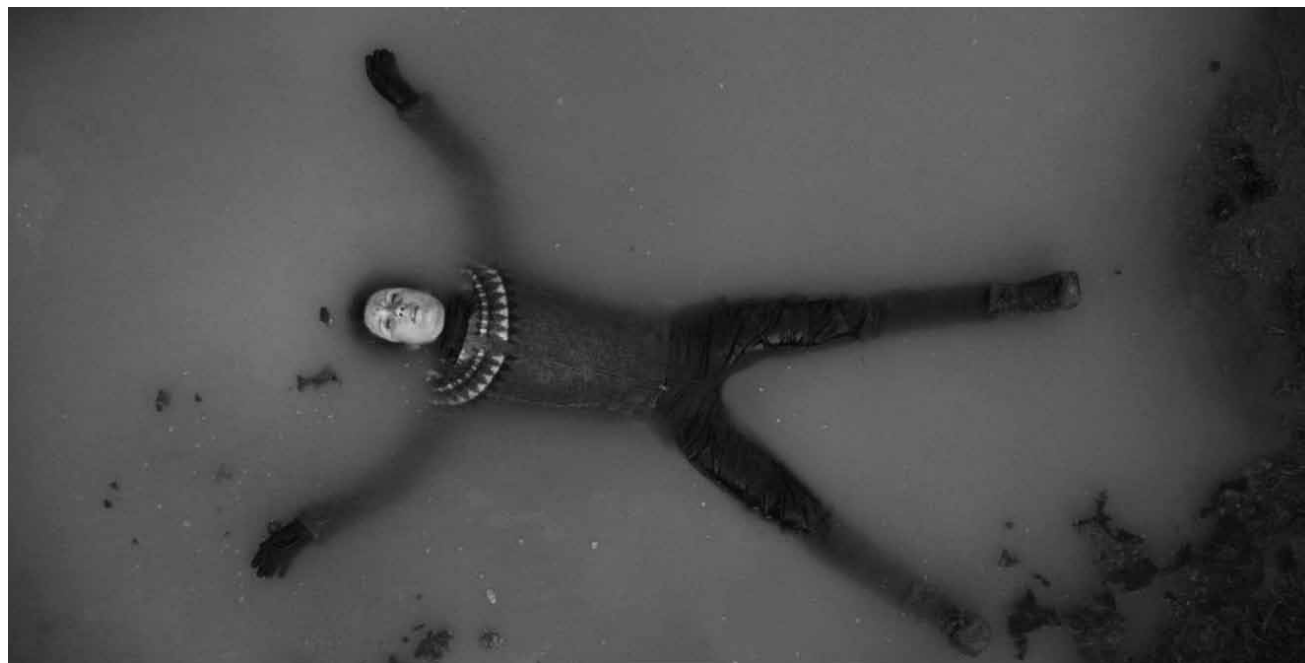
Chorleiterin und Sprengmeisterin für die gute Sache: in „Kona fer í stríð (Woman at War)“ muss eine Isländerin beides meistern – neu im Utopia.

Die 15-jährige Nisha lebt ein Doppelleben: Unter den Augen ihrer Eltern ist sie eine brave, traditionsbewusste pakistanische Tochter, die strikt den Vorgaben ihrer