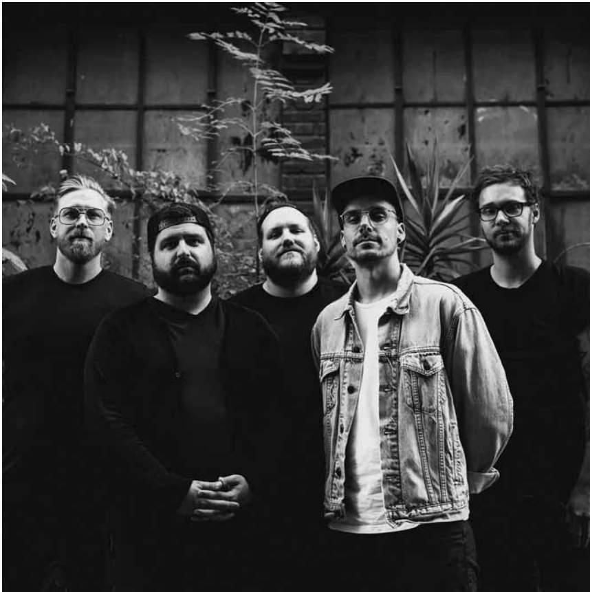
Von den freundlichen Ruinen ...