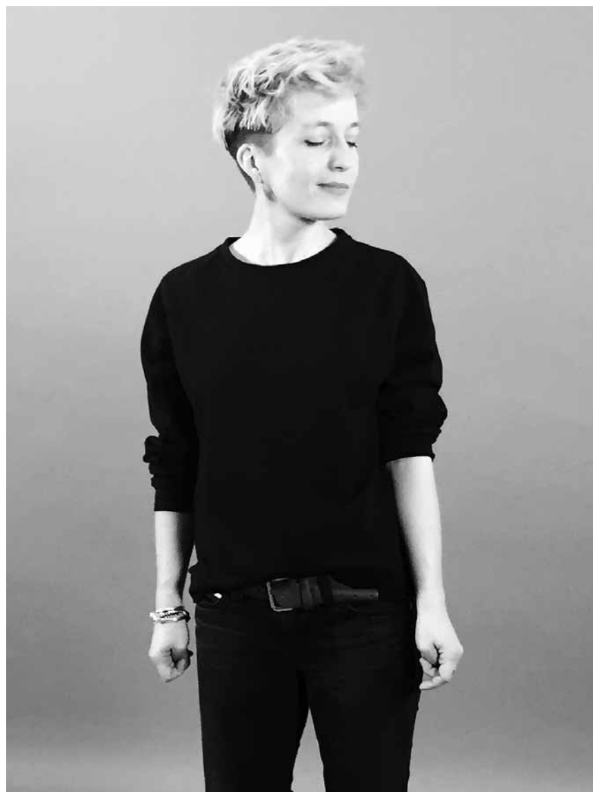
Nouvelle révélation du monde de la musique française, Jeanne Added présentera son deuxième album le 16 décembre à l'Atelier.