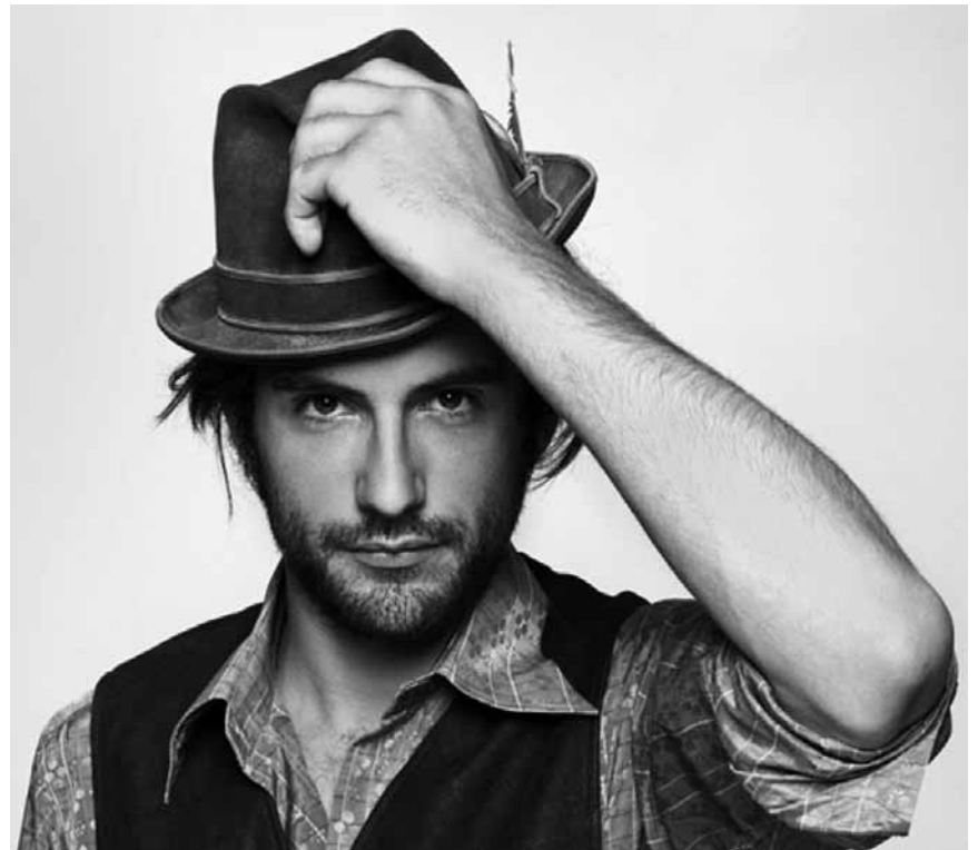
Blues-Rock aus San Francisco: The Ferocious Few heizen an diesem Freitag, dem 7. Dezember der Escher Kulturfabrik ein.