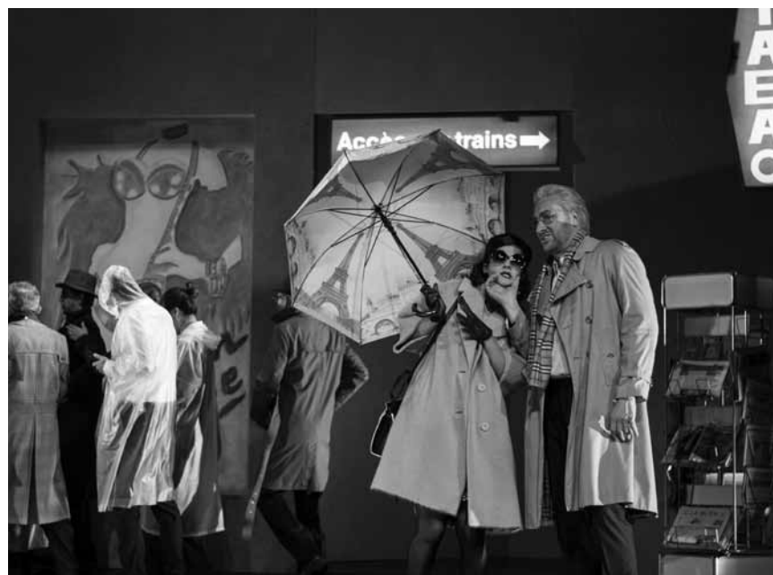
Ach, Paris, l'amour toujours: „Pariser Leben“ – die Operette von Jacques Offenbach wird an diesem Freitag, dem 7. und am 15. Dezember im Theater Trier gespielt.