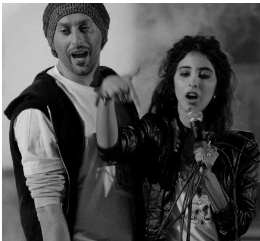
Rappen gegen den Hass: „Junction 48“ erzählt vom schweren Alltag im Israel-Palästina Konflikt - am 14. Dezember im Utopia.