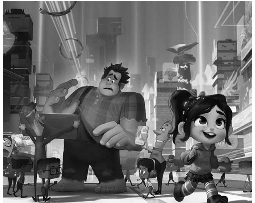
Wenn Arcade-Spiele-Figuren ins Netz ausbrechen: „Ralph Breaks the Internet“ - die neue Disney-Produktion läuft in fast allen Sälen.

Bohemian Rhapsody Mortal Engines Pachamama Ralph Breaks the Internet Superjhemp retörns The Grinch