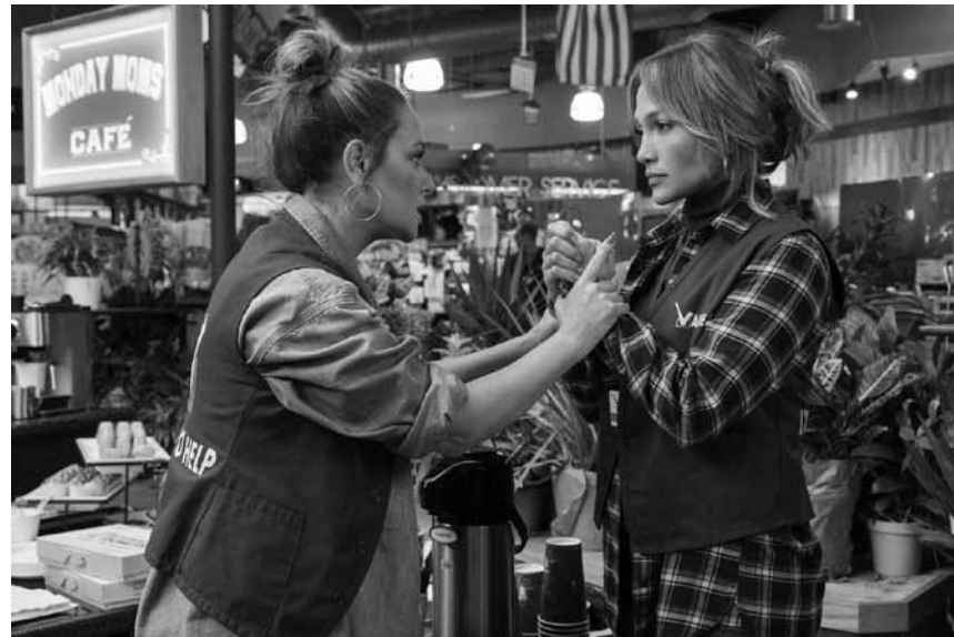
Ein US-Wintermärchen mit Jennifer Lopez: In „Second Act“ versucht eine Supermarktfilialeleiterin sich nach oben zu mogeln – neu im Kinepolis Kirchberg.

Der Grinch ist ein grüner, zynischer Miesepeter, der gemeinsam mit seinem treuen Hund Max in einer Höhle oberhalb des Dörfchens Whoville lebt, wo man Weihnachten über alles liebt. Der Griesgram hasst jedoch das Weihnachtsfest mehr als alles andere und findet die ausgelassenen Feierlichkeiten der Dorfbewohner fürchterlich. Also beschließt er, die Feierlichkeiten zu sabotieren und Weihnachten zu stehlen.