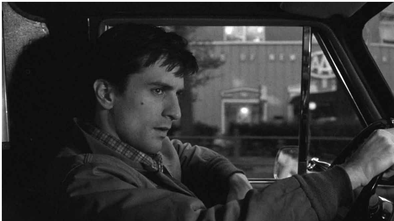
Der Streifen der Robert De Niro zur Legende machen sollte: „Taxi Driver“ von Martin Scorsese – am Dienstag, dem 19. Februar in der Cinémathèque.

Der amerikanische Soldat Jerry Mulligan erliegt den Verlockungen der französischen Hauptstadt Paris und beschließt, dort zu bleiben, obwohl der Zweite Weltkrieg beendet ist. Seine Liebe zu der Parfümverkäuferin Lise Bouvier steht jedoch unter keinem guten Stern, da die hübsche Frau bereits an den Sänger Henri Baurel vergeben ist.