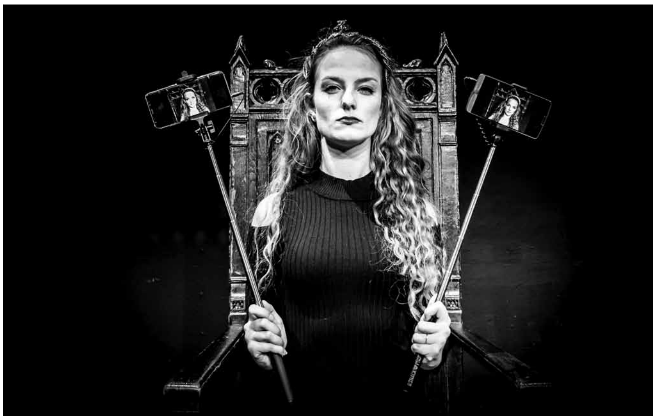
Horrortheater aus Frankreich: Grand Guignol lassen das Theater Trier am 3., 5., und am 8. Februar erzittern.