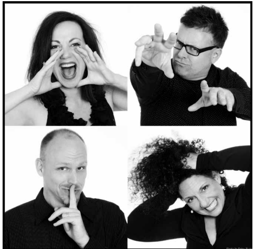
Après trente ans de carrière, les New York Voices savent toujours conquérir leur public - à vivre ce vendredi 17 mai à l'Artikuss de Soleuvre.