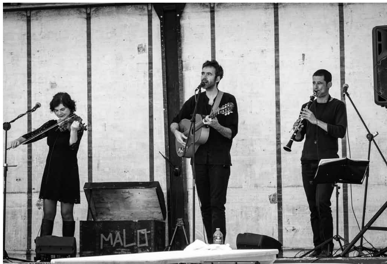
Malo, c'est une jeune troupe mixte qui rend hommage aux grands de la chanson française : ce vendredi 17 mai au Terminus de Sarreguemines, ils s'occuperont entre autres de Georges Brassens.

Game Over , Game-Theater-Projekt von Prinzip Gonzo, Alte Feuerwache, Saarbrücken (D) , 19h30.