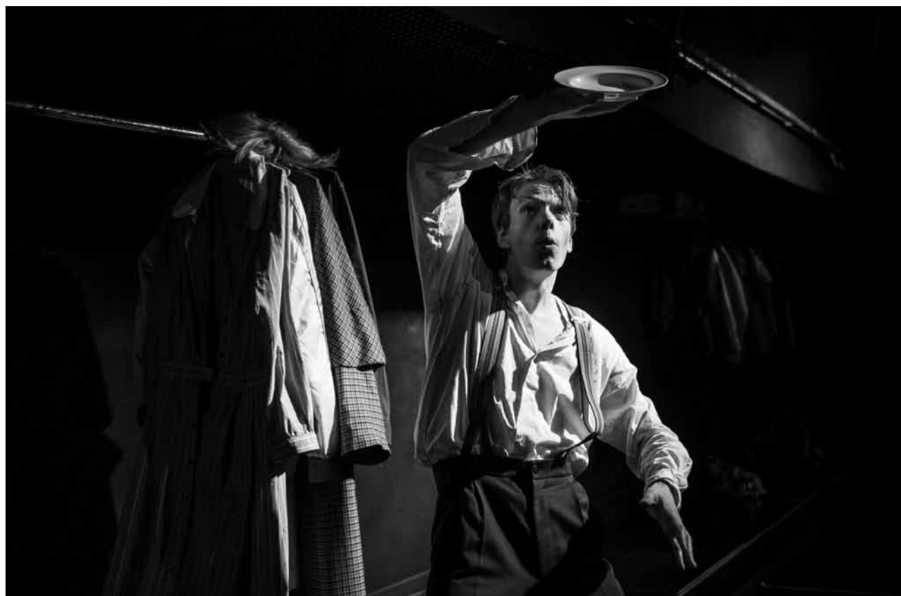
Aus der Welt von Jack London ins Theater Trier: „P'tit Albert“ – am 23. Mai.