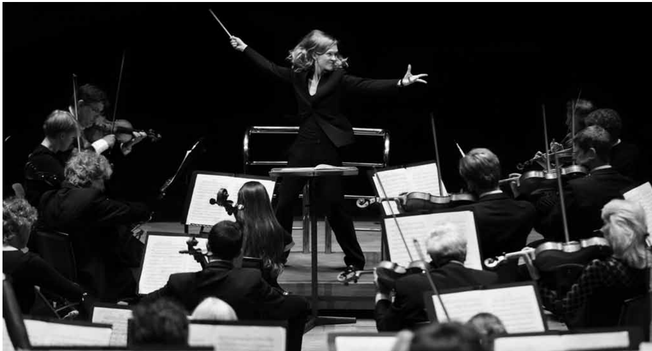
Le CBSO et sa directrice musicale, Mirga Gražinyte-Tyla : une belle équipe depuis déjà 2016.