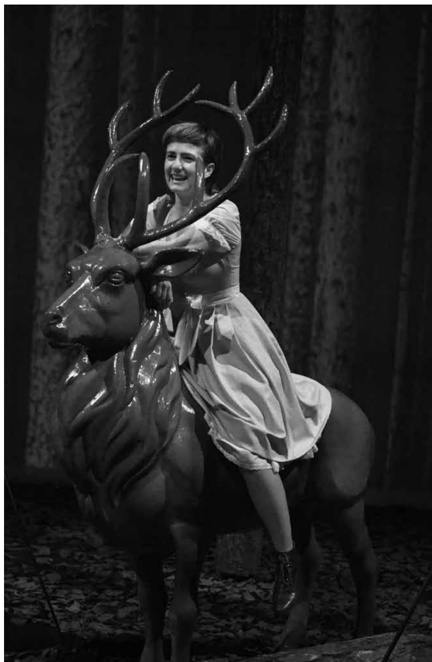
Ach, du grüne „Minna von Barnhelm“ - Lessings „Soldatenstück“ feiert an diesem Samstag, dem 18. Mai Premiere im Saarländischen Staatstheater in Saarbrücken.

Harmonie Union Troisvierges , musicals, moments & more 2.0, avec l'ensemble Estro armonico et The HUT Rhythm Group, sous la direction de Werner Eckes, Centre des arts pluriels Ettelbruck, Ettelbruck , 20h. Tel. 26 81 26 81. www.cape.lu COMPLET !