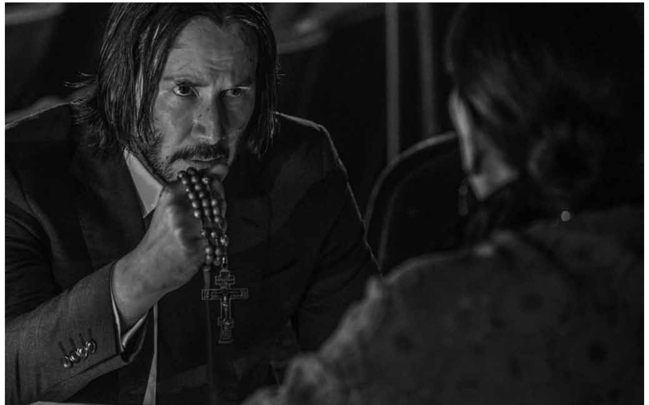
Wenn ein Auftragskiller einen Auftragskiller tötet und dann selbst von Auftragskillern getötet werden soll: So oder so ähnlich verläuft „John Wick: Chapter 3 – Parabellum“ – neu im Kinepolis Belval und Kirchberg.

In den 34 Jahren seiner Arbeitslaufbahn war der ruhige Italiener Fabrizio Collini stets ein im Hintergrund bleibender Mann, dem nie etwas vorzuwerfen war, bis zu dem Zeitpunkt, an dem er scheinbar grundlos in einem Hotel in Berlin