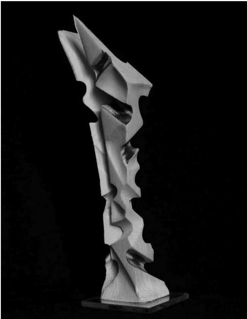
Das verflixte siebte Mal: In Differdingen geht am 2. Juni das 7. Internationale Skulpturensymposium vonstatten - mit unter anderem Werken von Carlos Abbà und Alice Murlina.

Frédéric Moïs : Scène-ographie photographies, maison de la culture (parc des Expositions, 1. Tél. 0032 63 24 58 50), jusqu'au 9.6, ma. - di. 14h - 18h.