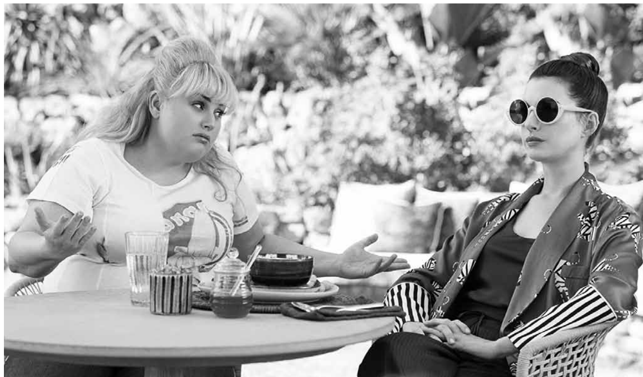
Zwei Frauen, die es der Männerwelt so richtig zeigen: „The Hustle“ – neu im Kinepolis Belval und Kirchberg.

D 2019, Kinderanimationsfilm von Andrea Block und Christian Haas. 88'. Fr. Fassung.