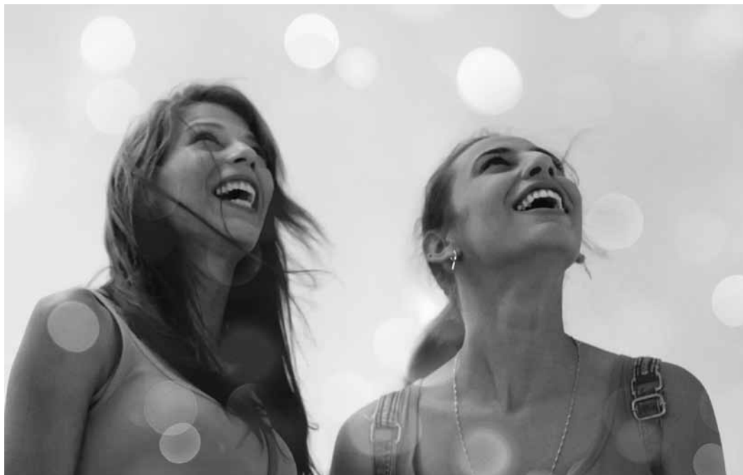
Un quotidien difficile, mais deux beaux sourires prêts à l'évasion.