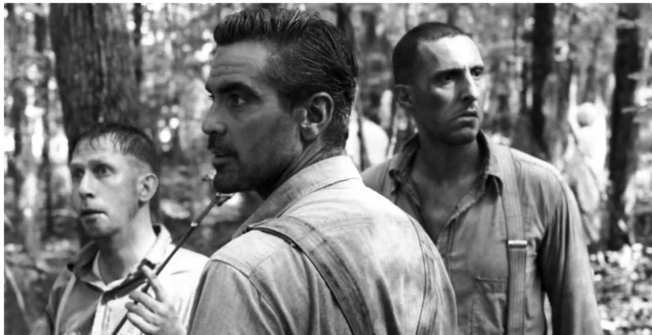
Wenn die Coen-Brüder griechische Mythologie und Western zusammenbringen: „O Brother, Where Art Thou?“ – am 25. Juli in der Cinémathèque.

Der Abenteurer und passionierte Kartenspieler Johnny Farrell will sich in Argentinien eine neue Existenz aufbauen. Zufällig begegnet er dem zwielichtigen Ballin Mundson, der ein illegales Casino in Buenos Aires betreibt und ihn beim Kartenspiel beobachtet hat. Jemanden wie Farrell kann der Geschäftsmann gut gebrauchen und er stellt ihn als seine rechte Hand ein.