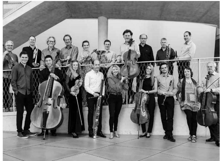
Bon départ de saison pour le KammerMuseumVeräin Lëtzebuerg : ce vendredi 13 septembre, il présente son nouveau CD en hommage à Schumann et à Kurtág, à l'abbaye de Neumünster.