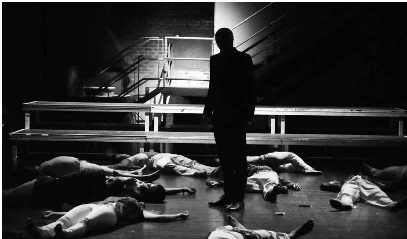
Une création collective pour raconter ce qui se passe hors de nos frontières : « Tous/All Migrants » fait halte à l'Aalt Stadhaus de Differdange le 19 septembre.

Projekt Woyzeck , mit Junges DNT Weimar, Inszenierungsprojekt von Robert Ziesenis, Alte Feuerwache, Saarbrücken (D) , 19h30. Tel. 0049 681 30 92-486. www.staatstheater.saarland Im Rahmen des 29. Bundestreffens „Jugendclubs an Theatern“.