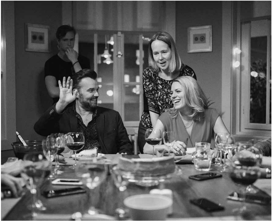
When your cell phone ruins New Year's Eve for everyone: "Búék" - at Neimënster on September 24th.