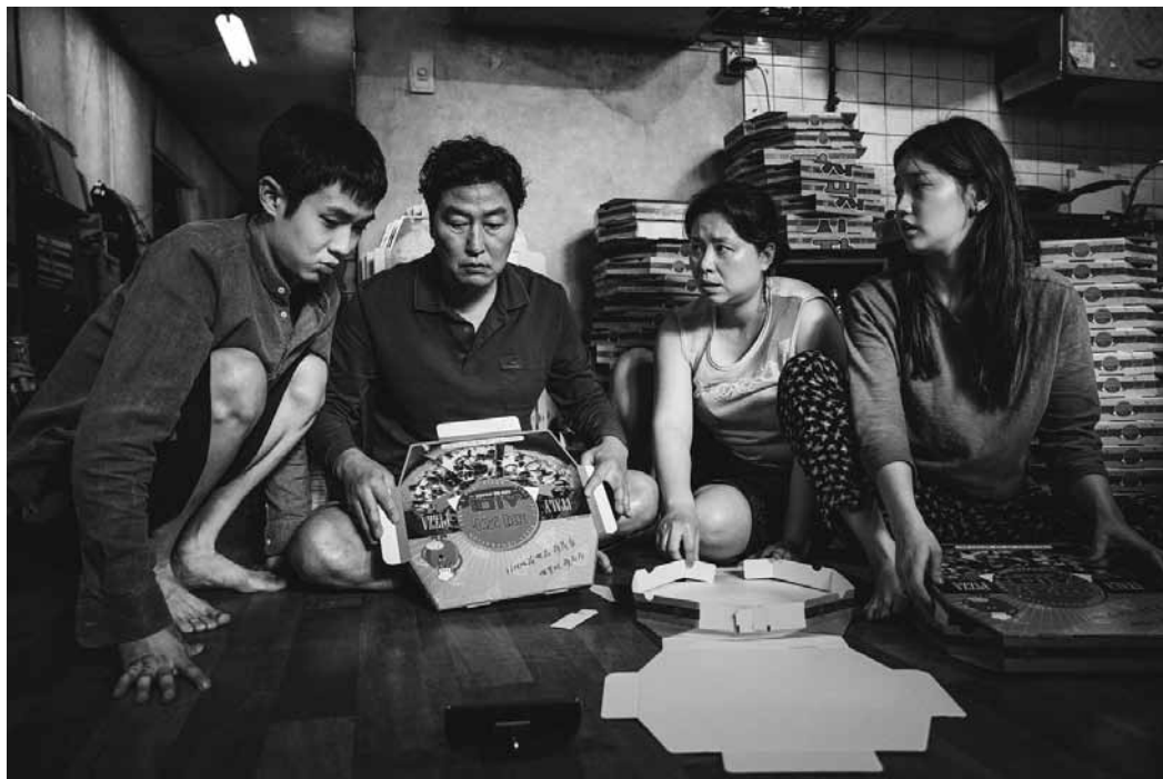
Familie Kim braucht dringend Geld – ein Plan muss her.