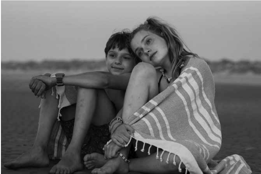
Die ersten Schritte einer außergewöhnlichen Jugendliebe: „My Extraordinary Summer with Tess“ – neu im Utopia.