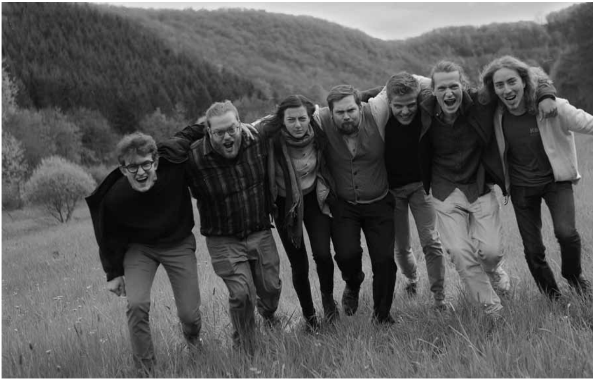
Zwei Jahre nach der Bandgründung präsentieren Le Vibe ihr Debütalbum „Day One“ in der Kulturfabrik in Esch.