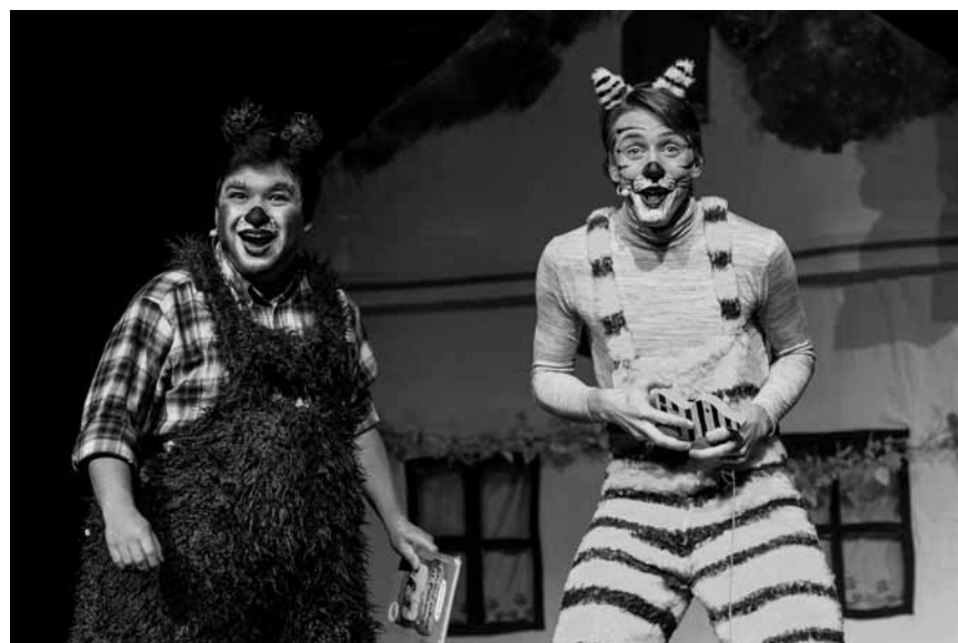
Nicht nur die Offshore-Konten sind dort zu bewundern: Janoschs Klassiker „Oh, wie schön ist Panama“ kommt an diesem Samstag, dem 21. September ins Trifolion nach Echternach.

2000's Party, Den Atelier, Luxembourg, 22h. Tel. 49 54 85-1. www.atelier.lu