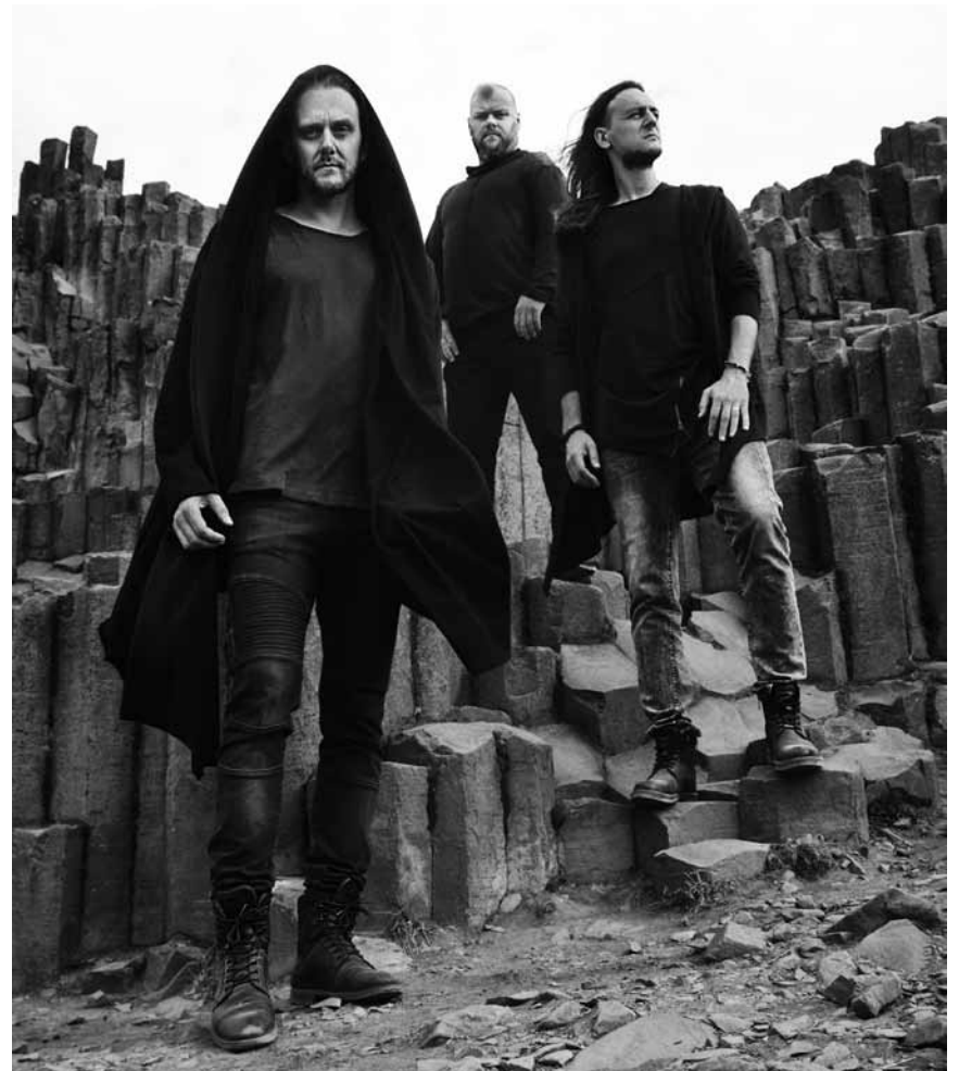
Du rock progressif et mélancolique made in Poland : la Kulturfabrik accueillera Riverside le 25 septembre.

Die TWMC TOP 20/40 bei: www.transglobalwmc.com , Facebook „Mondophon auf Radio ARA“ und woxx.lu (Willi Klopptek)