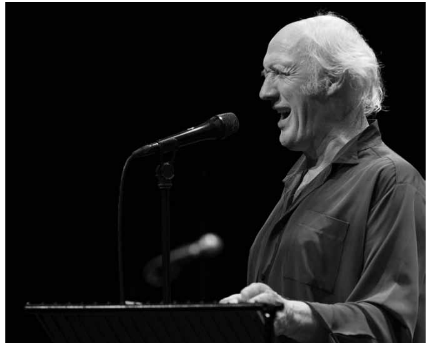
Der Barde aus Utrecht kehrt nach Ettelbrück zurück: Drei Jahre nach seinem letzten Konzert spielt Herman van Veen an diesem Freitag, dem 20. September wieder im Cape.