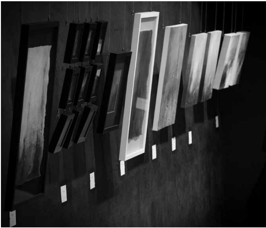
L'espace H2O à Oberkorn expose ses artistes résident-e-s - à découvrir jusqu'au 13 octobre.