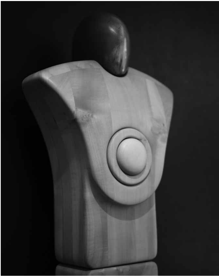
Se dépasser toujours et encore : « Au-delà du bois », les sculptures de Pitt Brandenburg sont à la Millegalerie de Beckerich du 5 au 27 octobre.

Bénédicte Genicot : Jump ! photographies, maison de la culture (parc des Expositions, 1. Tél. 0032 63 24 58 50), jusqu'au 13.10, ma. - di. 14h - 18h.