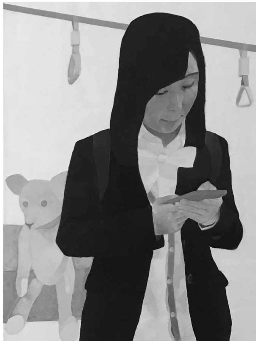
L'absorption du moi : « Me and I », de Nora Juhasz, à partir de ce samedi 28 septembre jusqu'au 16 octobre à la galerie Fellner Louvigny.

Visites guidées sa. 11h (L), 15h (D), 16h (F), di. 11h (GB), 15h (D), 16h (F).