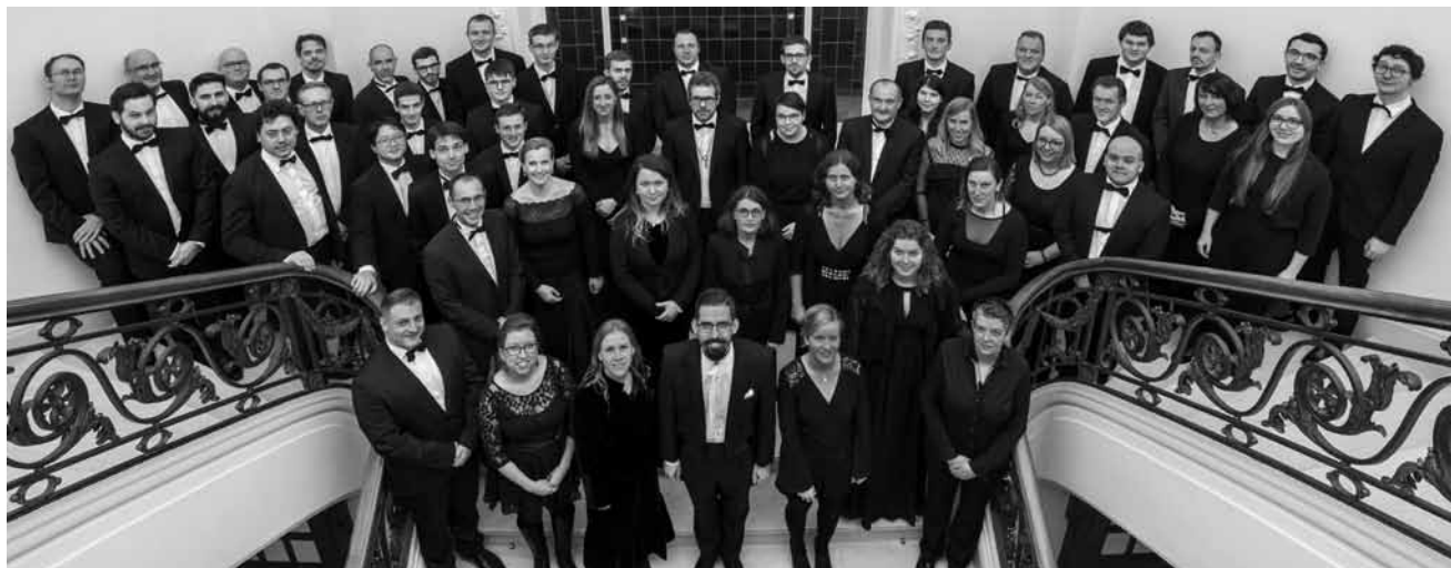
Allez, du vent ! Avec le Luxembourg Wind Orchestra, c'est même très agréable - à entendre ce samedi 28 septembre au Cape.