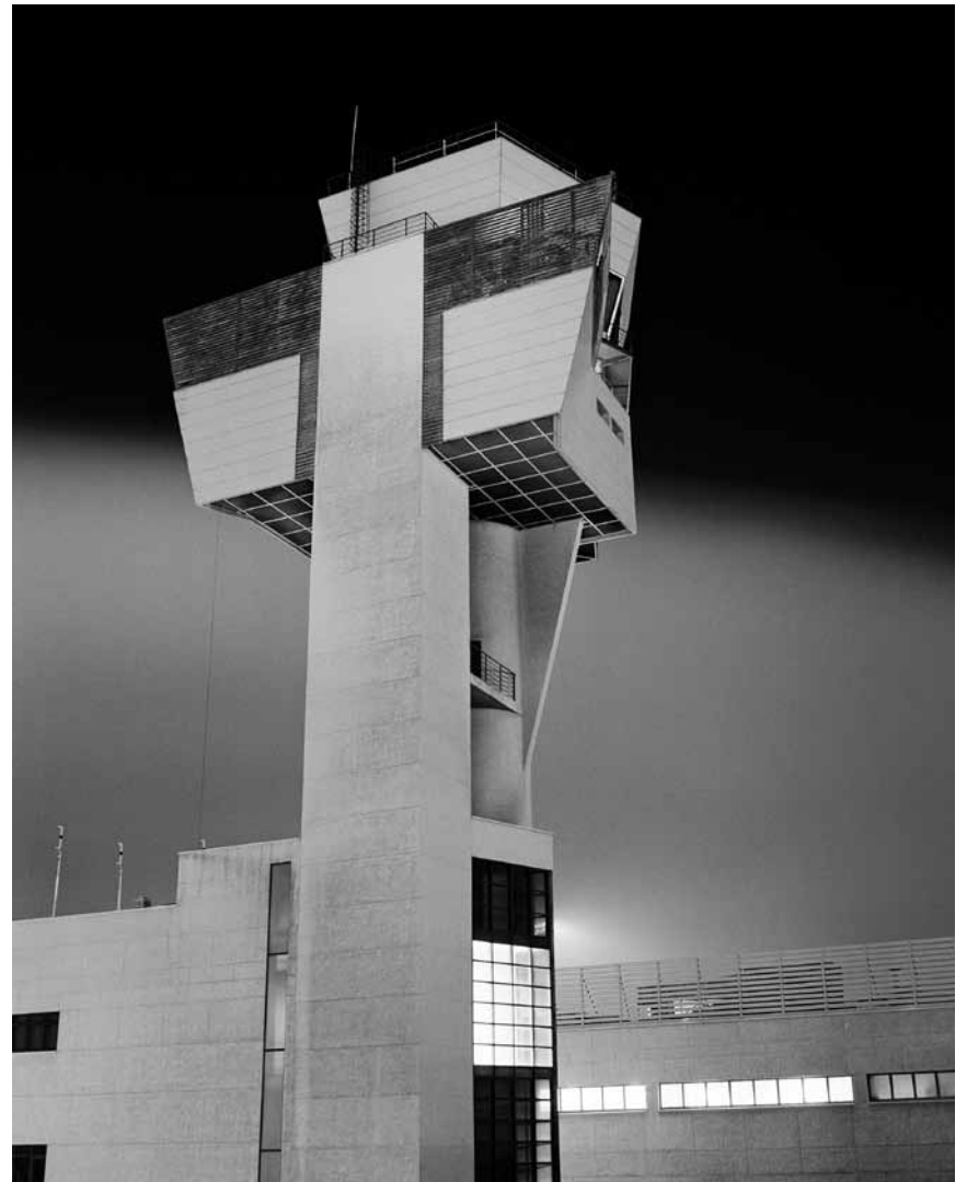
Die bereits in den 2000ern fertiggestellte Fotoreihe „Soma“ des aus Düsseldorf stammenden Fotografen Andreas Gefeller ist noch bis zum 25. September 2020 in der Échappée Belle in Clerf zu sehen.