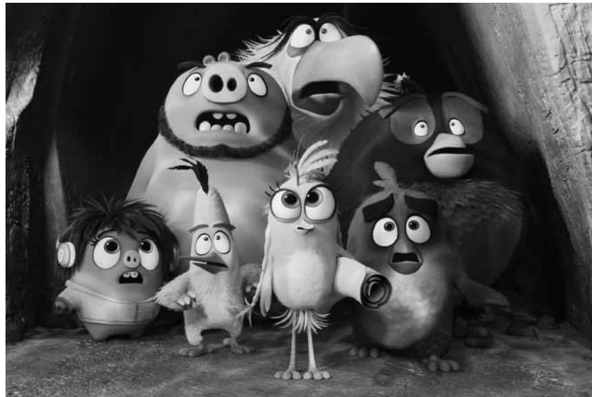
Wenn grüne Schweine und grantige Vögel sich zusammentun müssen: „The Angry Birds Movie 2“ - neu in fast allen Sälen.