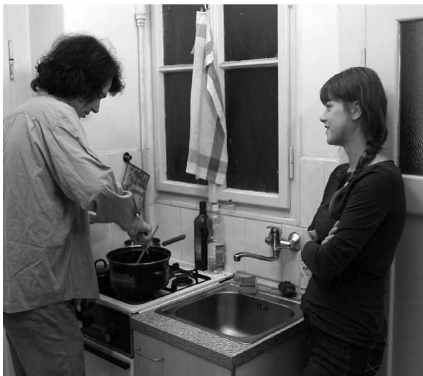
Les déboires quotidiens de jeunes Praguais-e-s d'aujourd'hui sont au centre de « Karel, já a ty (Karel, Me and You) » - le 8 octobre à Neimënster, dans le cadre du festival Cineast.

pour se moquer en creux de vrais sujets liés à la politique et aux moyens de subsistance en Russie.