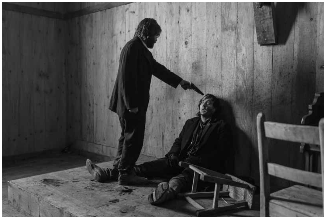
Une spirale de la violence sans fin.