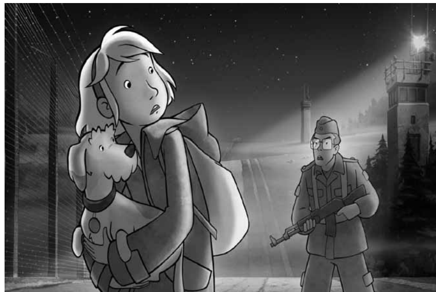
Fast pünktlich zum Fest der deutschen Einheit in den Kinos: „Fritzi - Eine Wendegeschichte“, am 13. Oktober im Utopia, im Rahmen des Cineast-Festivals.

Comédie noire et ironique qui se déroule dans l'Union soviétique avant la révolution d'Octobre et illustre le rêve d'un pauvre paysan de devenir roi. Ce film muet utilise l'absurdité et l'humour de style slapstick comme une sorte de plaisanterie irréaliste