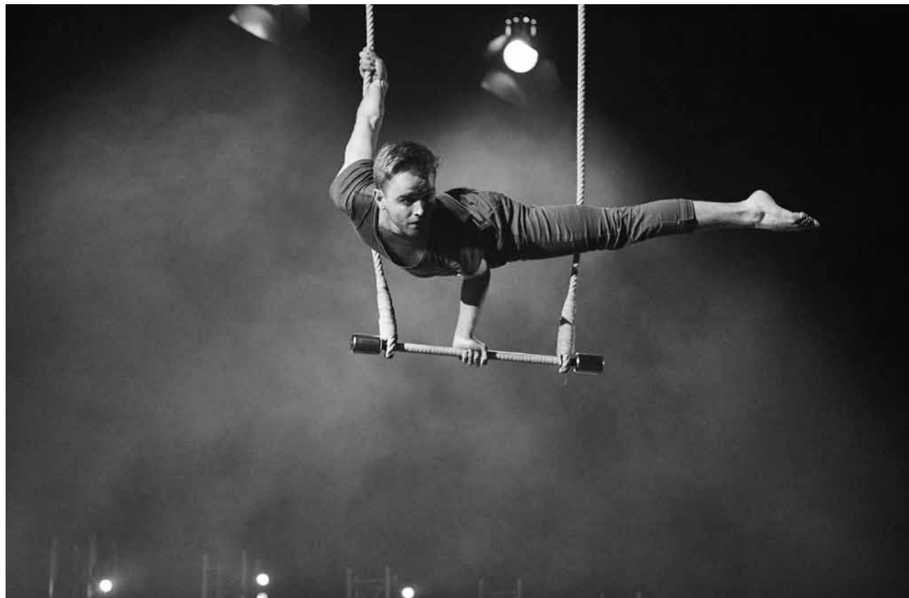
„Filament - The Circus Club“ ist ein Zirkusspektakel, das sich vom 1980er-Film „The Breakfast Club“ inspiriert, an diesem Sonntag, dem 6. Oktober im Cube521 in Marnach.

Fête de la sorcière , dans tout le village, Rodemack (F) , 10h - 18h.