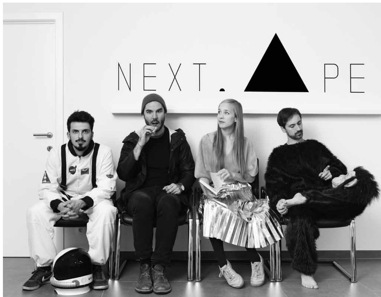
Quelque part entre Radiohead, Miles Davis et Modeselektor : Next.Ape se lancera le 11 octobre au Prabbeli à Wiltz.