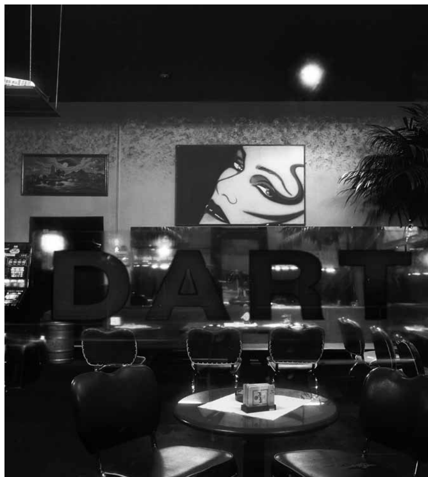
Die Berliner Fotografin Anna Lehmann-Brauns lässt leere Räume Geschichten erzählen: „Sun in an Empty Room“ - in den Arcades in Clerf bis zum 25. September 2020.