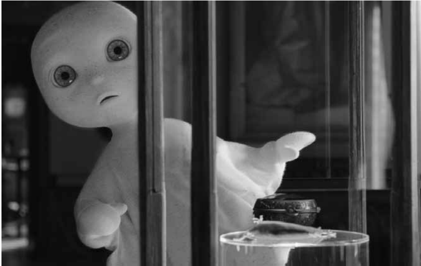
„Das kleine Gespenst“ will doch nur spielen ... und spukt am 3. November in der Cinémathèque.

einmal gut gegangen zu sein. Doch dann steht Alek Spera vor der Tür, und nichts ist mehr so, wie es war.