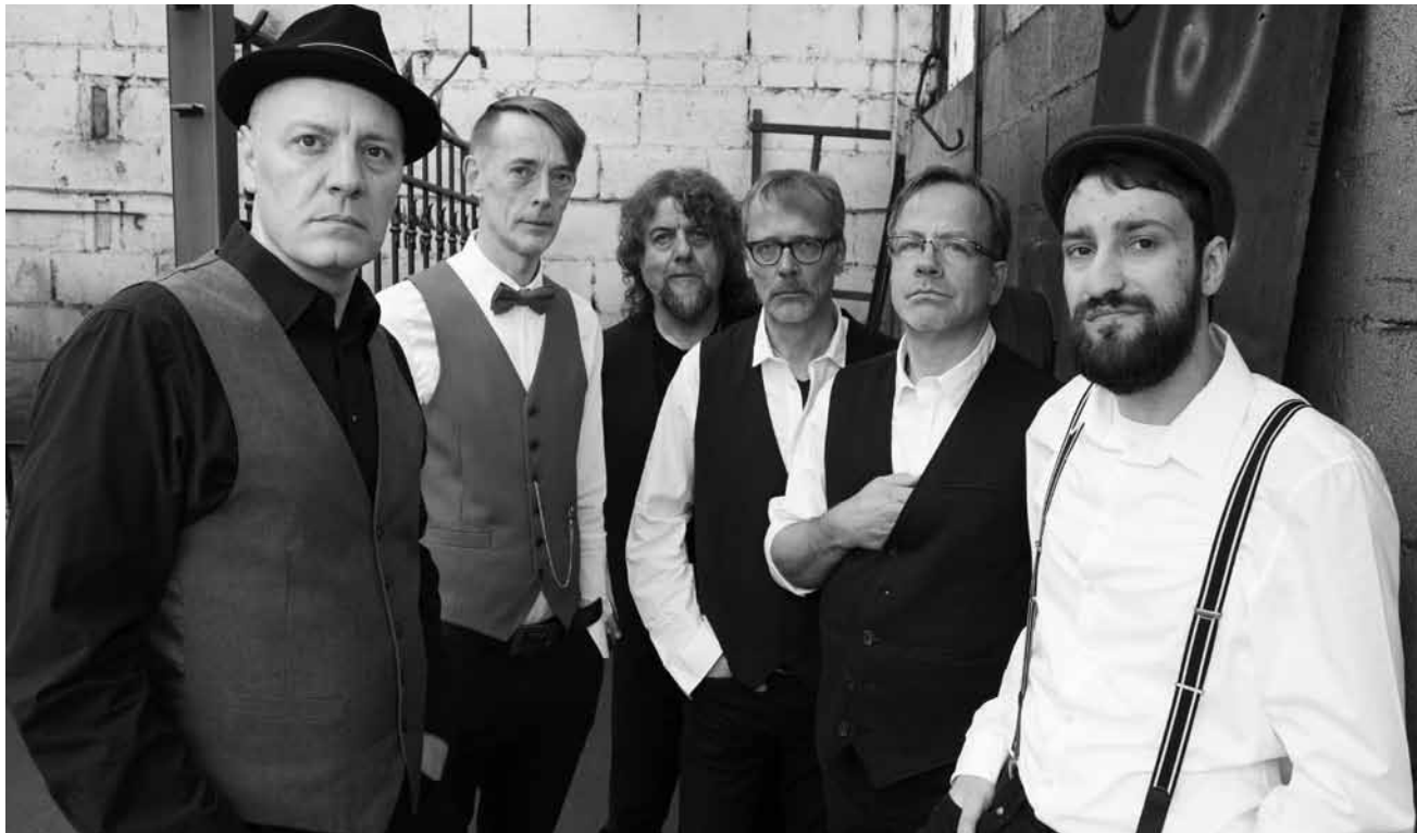
Irischer Folk mit einem Hauch Countrymusik: Die Ghosttown Company besucht am 1. November die Tufa Trier.