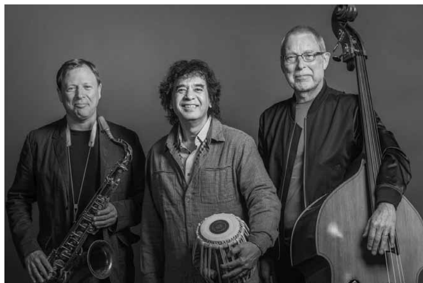
À contre-courant : le Cross Currents Trio de Dave Holland, Zakir Hussain et Chris Potter explore les frontières du jazz - le 25 octobre à la Philharmonie.