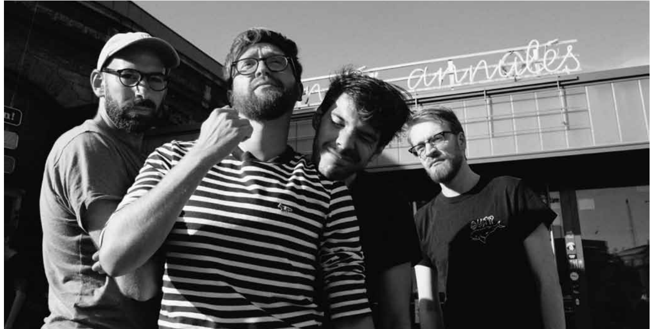
La bonne musique pour la saison : Autumn Sweater présentent leur nouvel album entouré de musicien-n-es ami-e-s ce samedi 26 octobre aux Rotondes.