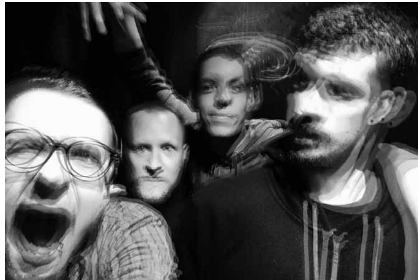
Pas toujours très clairs dans leurs idées : The Majestic Unicorns From Hell.

Ils sont passés par les sons métalliques et les orgies post-rock, mêlant doom métal et instruments à vent, expérimentant avec des samples et proposant des chansons dépassant aisément la vingtaine de minutes. Bref, ce groupe ne plaît certes pas à tout le monde, mais s'en bat les steaks. Depuis 2016, ils ont d'ailleurs accueilli un nouveau membre : Yann Dalscheid, ex-chanteur de la formation metal-core An Apple A Day, officie derrière le micro et a initié une nouvelle ère