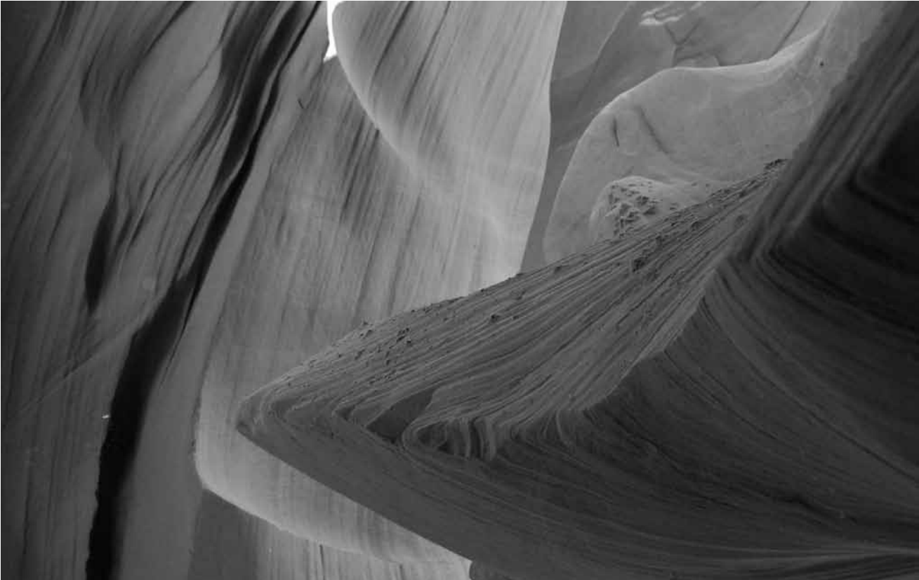
Ob der Titel nicht doch zweideutig zu verstehen ist? „Stoned“, von Eilo Elvinger, ab dem 5. Dezember und bis zum 18. Januar 2020 in der Valerius Art Gallery.

Eilo Elvinger et Syed Wasama Doja : I Am a Rohingya photographies, galerie Clairefontaine, espace 1 (7, pl. de Clairefontaine. Tél. 47 23 24), jusqu'au 21.12, ma. - ve. 10h - 18h30, sa. 10h - 17h.