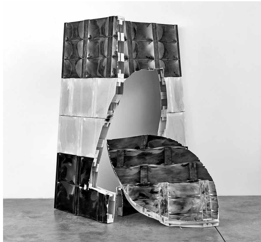
Les nouvelles œuvres de l'artiste luxembourgeois Roland Quetsch sont à découvrir à la galerie Ceysson & Bénétière au Windhof, du 14 décembre au 14 février 2020.

Historisches Museum Saar (Schlossplatz 15. Tél. 0049 681 5 06 45 01), bis zum 21.5.2020, Di., Fr., So. 10h - 18h, Mi. + Do. 10h - 20h, Sa. 12h - 18h.