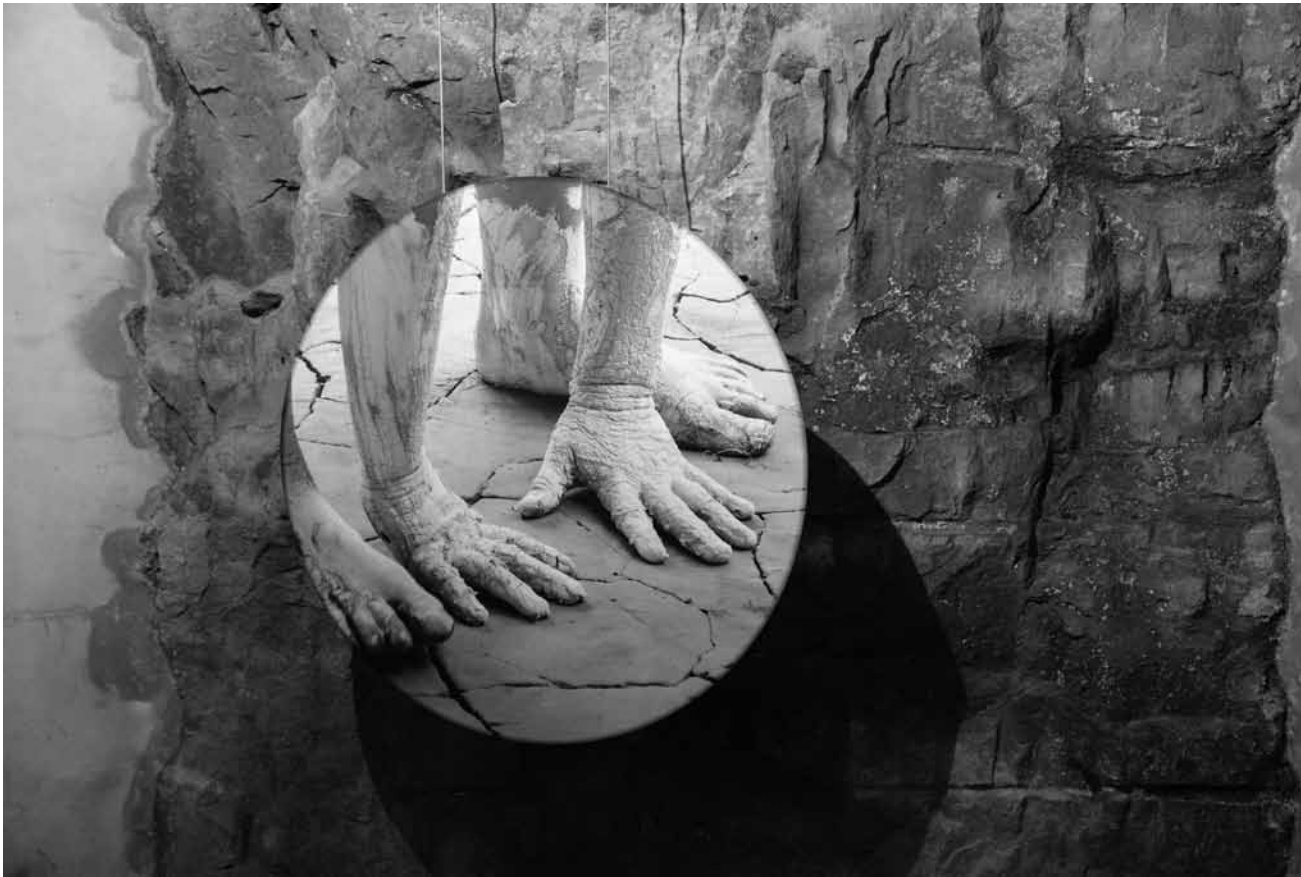
La proximité entre l'être humain et la Terre est célébrée dans le tunnel menant à l'ascenseur du Grund : « Krik et craque - Human Canvas » est organisée par le service des foyers scolaires de la Ville de Luxembourg - jusqu'au 29 mars 2020.

« Le Mudam frappe fort avec son hommage à David Wojnarowicz, artiste, poète, musicien et activiste du New York des années 1980 - qui nous rappelle que l'évolution de la société n'est pas si linéaire. » (lc)