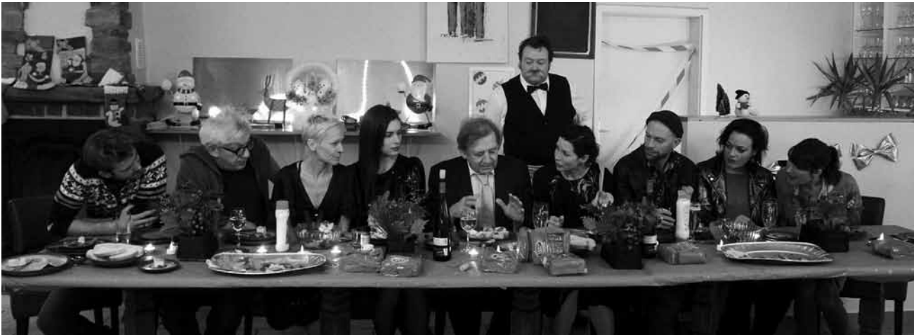
Dernier repas ? La traditionnelle fête de Noël va déchaîner les jalousies et les passions.