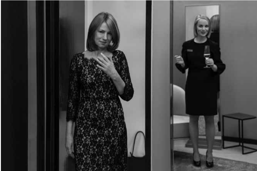
Wenn eine lebenslange Obsession endlich Früchte trägt und man nicht eingeladen ist: „Lara“ - neu im Scala.

und Spencer ist verschwunden. Gemeinsam entscheiden sich die Freunde dafür, die gefährliche Welt von Jumanji erneut zu betreten, um ihren verschollenen Kumpel zu retten.