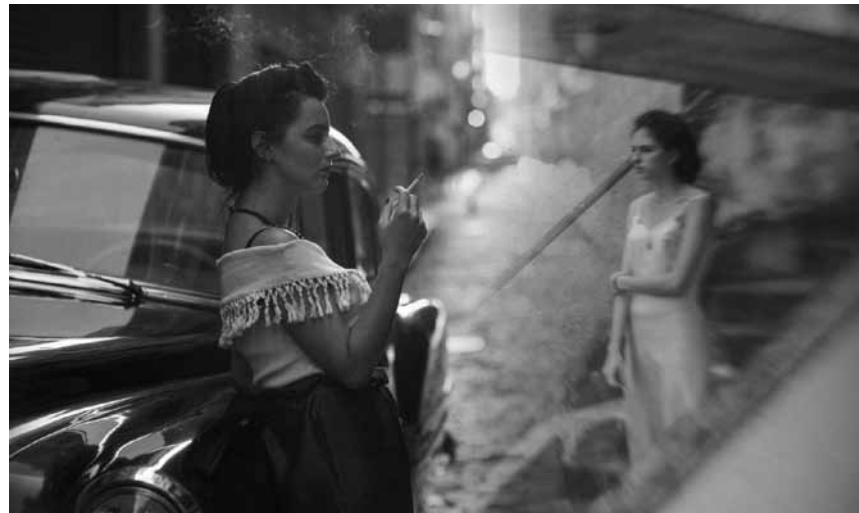
Zwei unzertrennliche Schwestern plus ein konservatives Elternhaus ergeben: Großes Drama - „A vida invisível de Eurídice Gusmão“ - neu im Utopia.

Shaun versucht sich mal wieder an neuen Streichen, um den monotonen Farmalltag etwas in Schwung zu bringen. Im Gegensatz zu seiner folgsamen Schafherde versucht Hütehund Bitzer jedoch immer wieder, seine Vorhaben zu vereiteln.