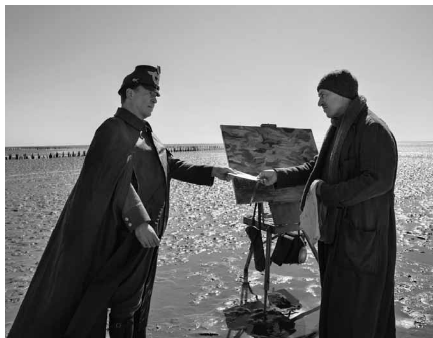
Schuld und Pflicht unter den perversen Gesetzen des NS-Regimes: „Deutschstunde“ basiert auf Siegfried Lenz' Roman von 1968 - neu im Scala.

Après sept années de crise, la Grèce est au bord du gouffre. Des élections, un souffle nouveau et deux hommes qui vont incarner l'espoir de sauver leur pays de l'emprise qu'il subit. Nommé par Alexis, Yanis va mener un