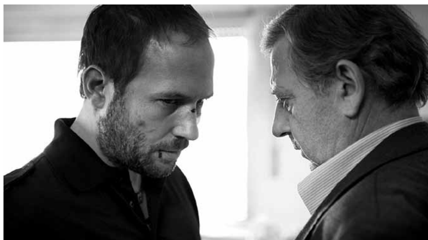
Och déi Lëtzebuurger Police huet hir knaschteg Geheimnisser: „Doudège Wénkel“ – den 9. Dezember am Scala.