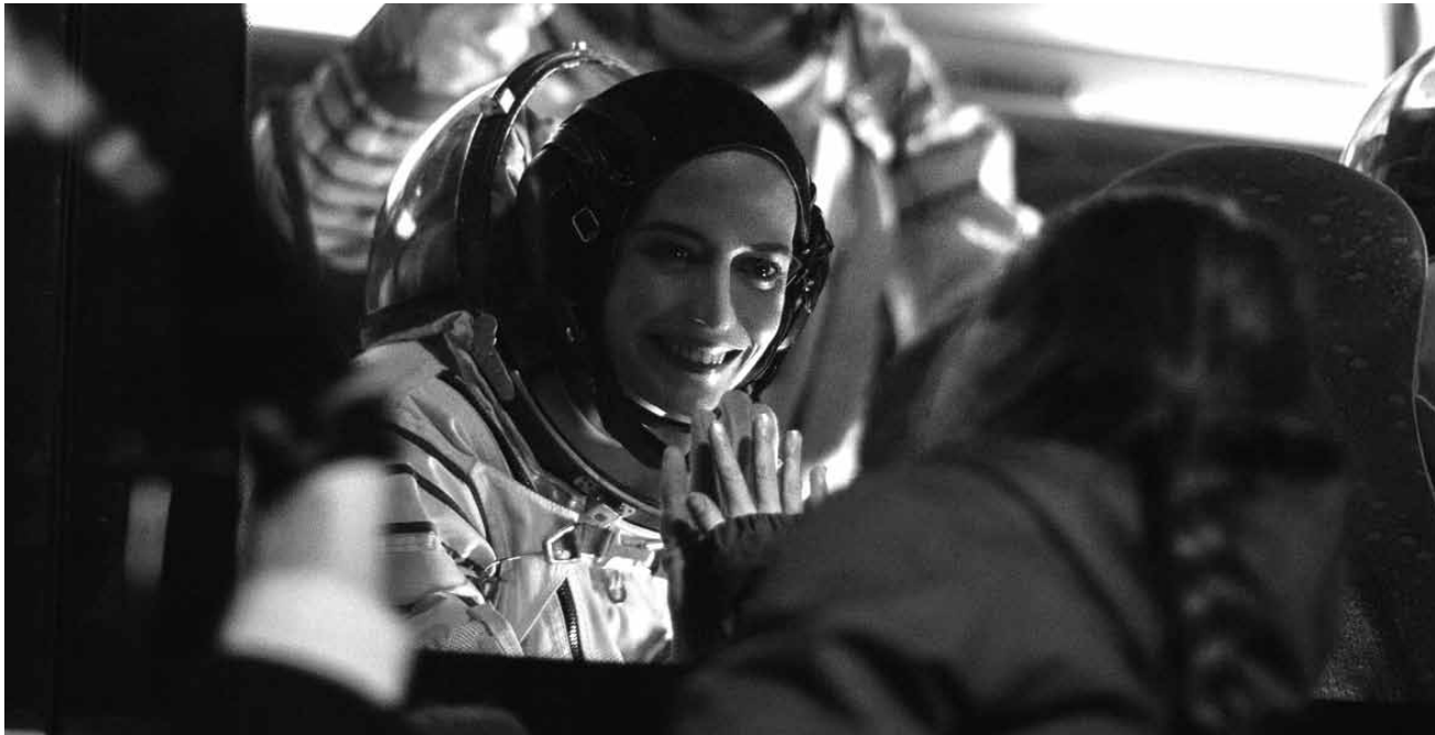
« Proxima » donne une nouvelle dimension à la séparation familiale.