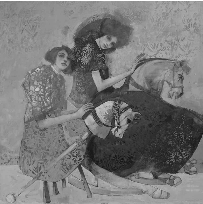
La peintre champenoise Lilas Blano a le sens de la découpe : du 11 janvier au 8 février, elle expose - avec le Brésilien Mozart Guerra - à la galerie Schortgen.

Nicolas Rasson NEW photographie animalière, maison de la culture (parc des Expositions, 1. Tél. 0032 63 24 58 50), jusqu'au 9.2, ma. - di. 14h - 18h.