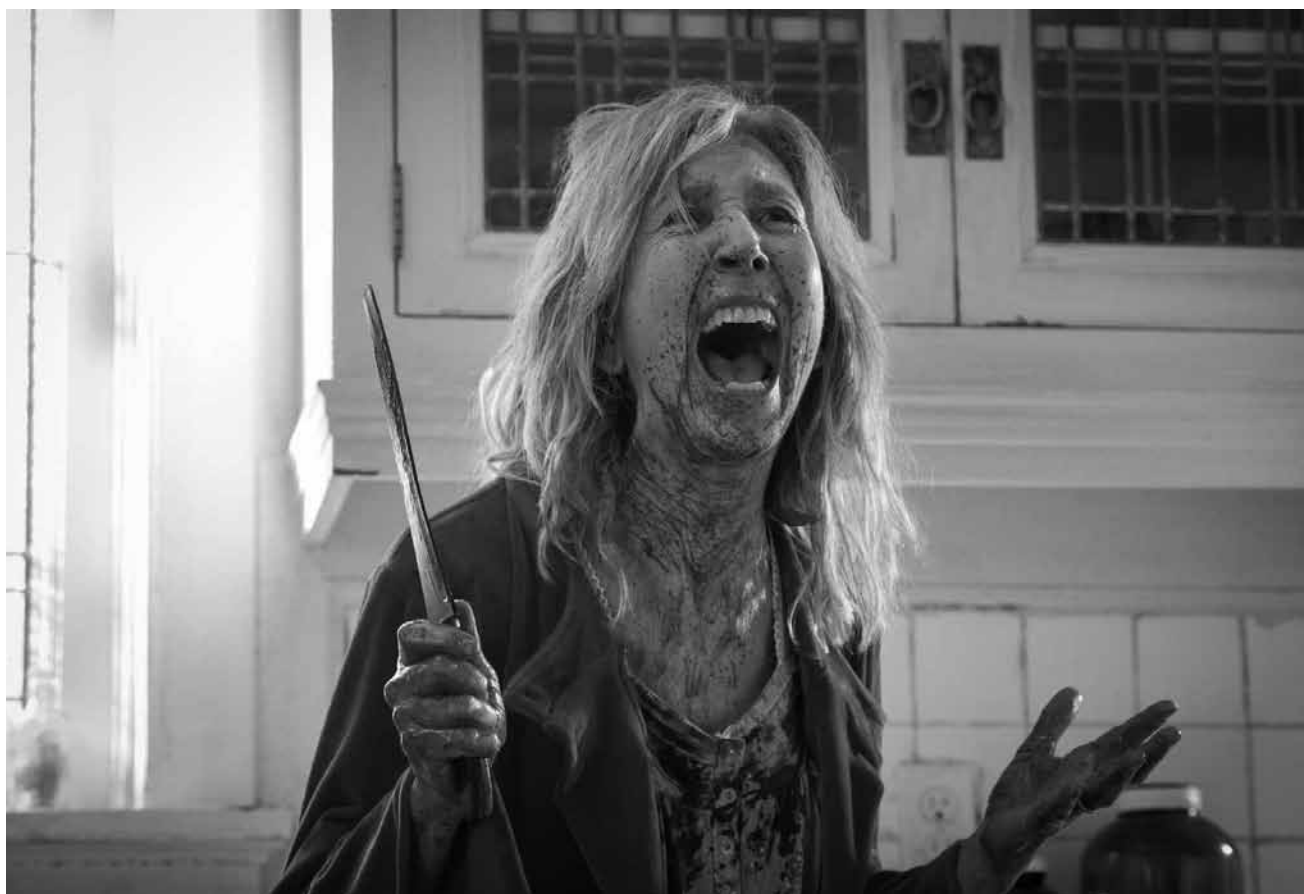
Augen auf beim Häuserkauf – am besten ohne Fluch und dämonische Rachegeister: „The Grudge“ – neu im Kinopolis Belval und Kirchberg.

Maud Crayon est née dans les Vosges mais vit à Paris. Elle est architecte, mère de deux enfants, et remporte sur un énorme malentendu le grand concours lancé par la mairie de Paris pour réaménager le parvis de Notre-Dame. Entre cette nouvelle responsabilité, un amour de jeunesse qui resurgit subitement et le père de ses enfants qu'elle n'arrive pas à quitter complètement, Maud Crayon va vivre une tempête. Une tempête qu'elle devra affronter pour s'affirmer et se libérer.