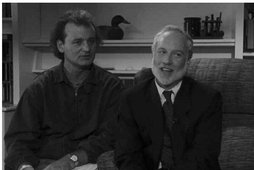
Bill Murray als verrückter Trottler, der seinen Psychiater jagt: „What about Bob?“ von Franz Oz, an diesem Samstag, dem 18. Januar in der Cinémathèque.

In einer Zoohandlung lernen sich in die Millionärstochter Melanie Daniels