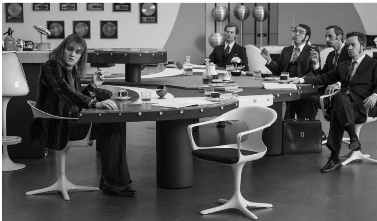
Ob den Biopic-Machern die Toten ausgegangen sind? Nach Hape Kerkeling hat jetzt auch Udo Lindenberg sein Filmchen bekommen: „Lindenberg! Mach dein Ding“ – neu im Kulturhuof Kino, Le Paris, Orion, Scala, Starlight und Sura.

Der Regisseur Elia Suleiman flüchtet aus seiner Heimat Palästina. Auf der Suche nach einer Stadt, in der er ein neues Zuhause begründen kann, findet er jedoch immer wieder unerwartete Parallelen zu seinem alten Heimatland. Fast ist es, als würde Palästina ihn bei seinem versuchten Neuanfang verfolgen, egal wohin er auch geht. Die gleichen Probleme,