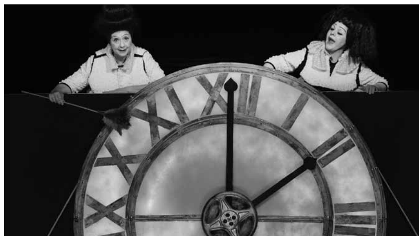
Le rire est une panacée ouverte à tous les âges : « Slap's Tic », spectacle pour enfants de 4 à 8 ans, le 9 février à la maison de la culture d'Arlon.

Der Bär, der nicht da war , audiovisuelles Musiktheater, mit dem Theater Marabu (> 5 Jahre),