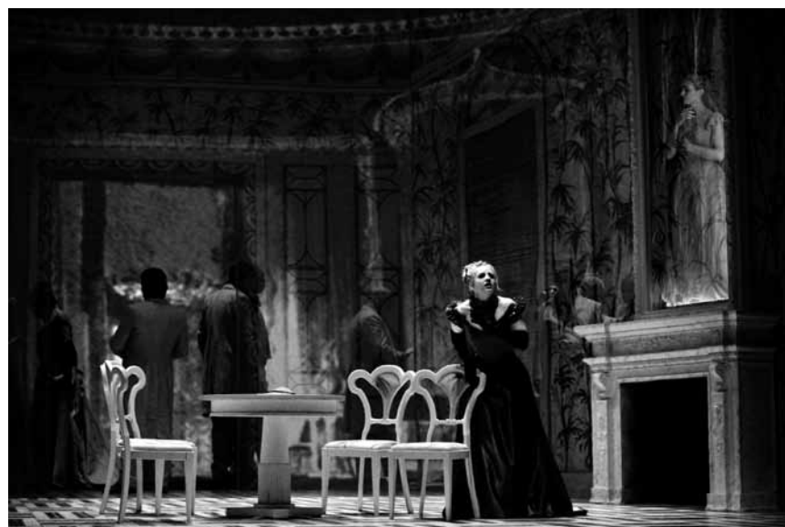
Décrié comme antibourgeois à l'époque, « La Traviata » reste un des opéras les plus connus de Giuseppe Verdi - les 2, 4, 6 et 8 février à l'Opéra de Metz.

Big Nightmare Music , ein musikalischer Wahnsinn für die ganze Familie, mit dem Orchestre philharmonique du Luxembourg und Igudesman & Joo, Werke von unter anderen Igudesman, Joo und