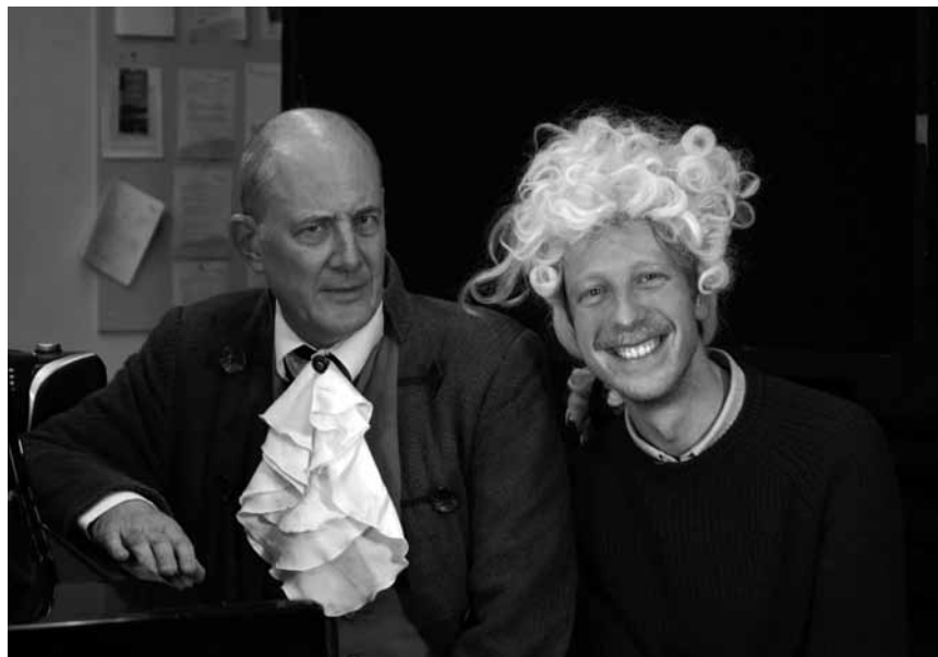
Eine theatralische Hommage an einen Komponisten, der heute noch Erstaunen auslöst: „Amadeus“ - am Saarländischen Staatstheater Saarbrücken am 7. Februar.