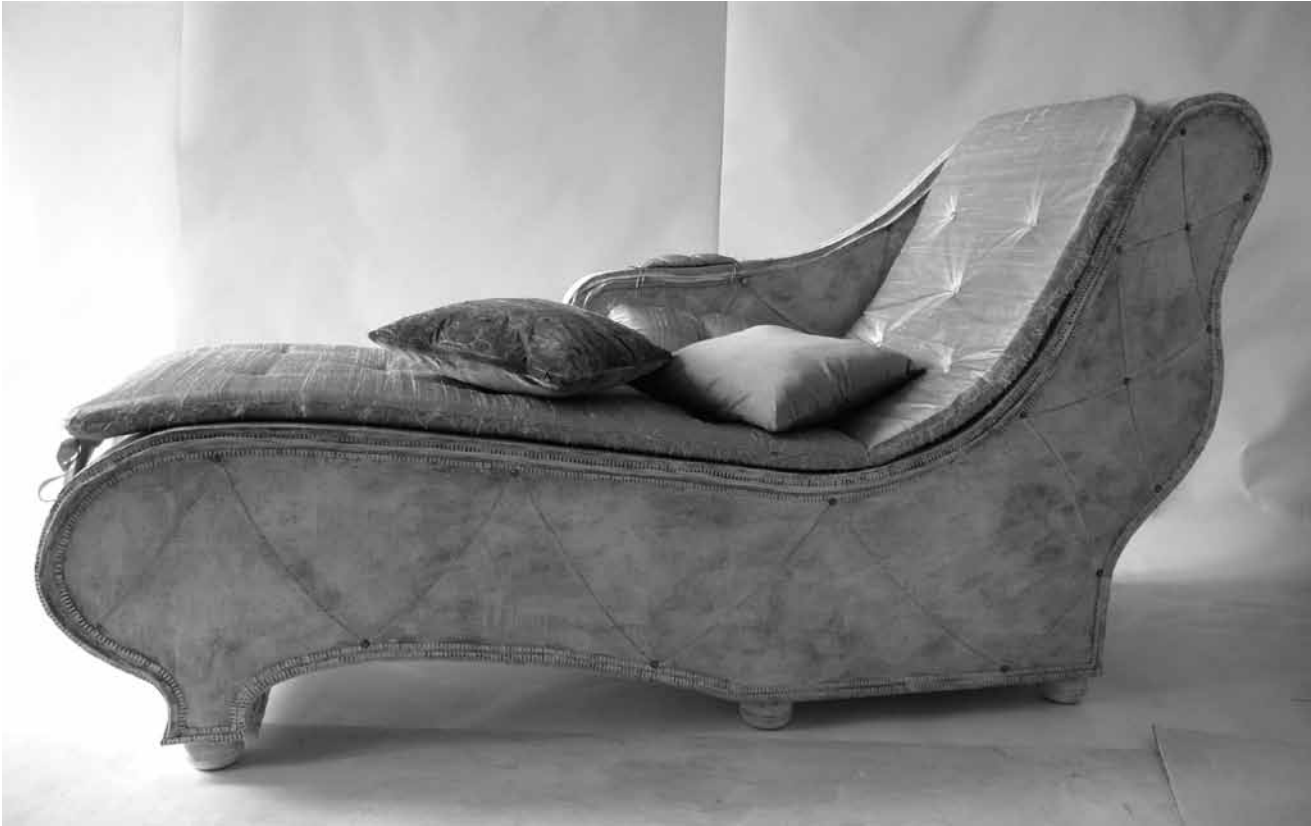
Möbel, die man nicht aufmöbeln muss: Tine Krumhorns mobilier d'art ist vom 10 März bis zum 2. April im Trifolion in Echternach zu sehen.

vidéo, Rotondes (rue de la Rotonde. Tél. 26 62 20 07), jusqu'au 31.5, lu. 10h - 15h, ma. - ve. 11h - 1h, sa. 10h - 1h, di. 10h - 19h.