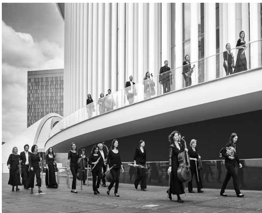
L'Orchestre de chambre du Luxembourg investira la Philharmonie avec son concert « Crossing Europe - Visiting Romania » sous la direction d'Olivier Grangean.

18h. Tel. 0049 681 30 92-0. www.staatstheater.saarland