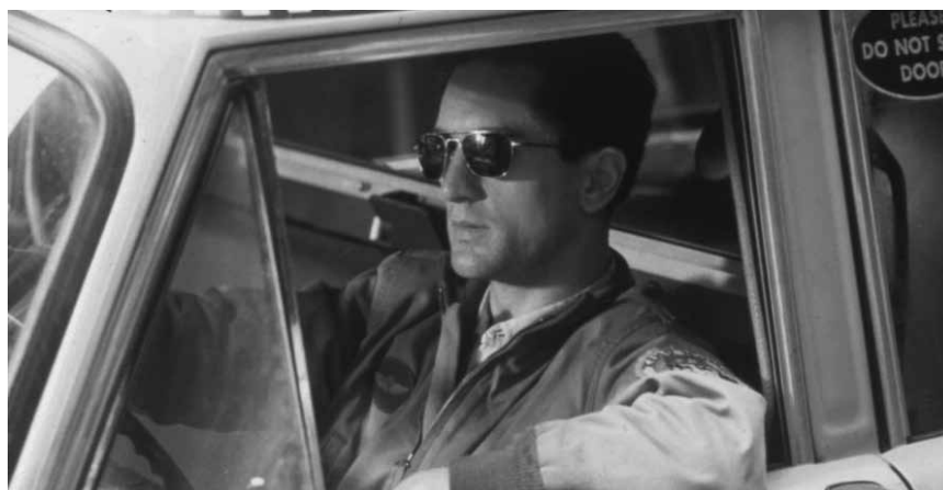
Ein Klassiker auf Leinwand mit musikalischer Untermalung. Dieses Jahr im Ciné-Concert: „Taxi Driver“ von Martin Scorsese, an diesem Samstag, dem 11. Januar in der Philharmonie.

Taxi Driver, ciné-concert, avec l'Orchestre philharmonique du Luxembourg, sous la direction de Robert Ziegler, Philharmonie, Luxembourg, 20h. Tél. 26 32 26 32. www.philharmonie.lu