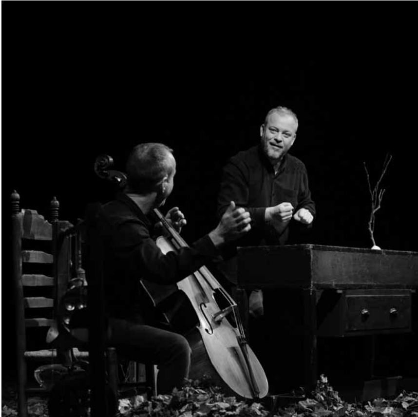
Soulaang de Wollef net vun der Bühn erof fällt: « Rotkäppchen », inszenéiert vun der Astrid Howard mam Traffik Theater - den 18. an den 19. Januar am Escher Theater.

Bleach , tribute to Nirvana, Spirit of 66, Verviers (B), 20h30. Tél. 0032 87 35 24 24. www.spiritof66.be