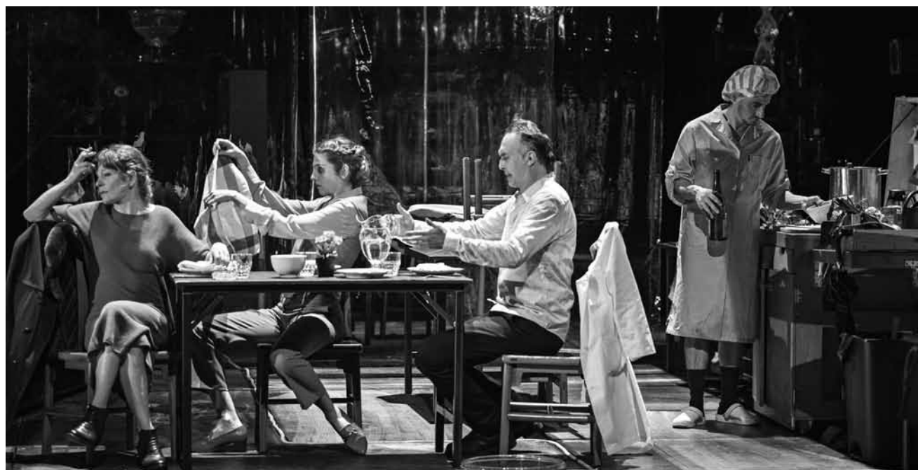
Intrigues, fraticides et lanceurs d'alerte sont au rendez-vous pour « Un ennemi du peuple » d'Henrik Ibsen, les 15 et 16 janvier au Grand Théâtre.

Orchestre symphonique du conservatoire, sous la direction de