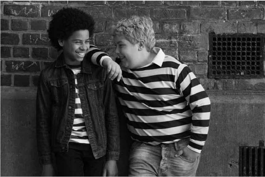
Le roi de la triche est de retour : « Ducobu 3 » doit sauver son école en chantant - nouveau au Kinepolis Kirchberg et Belval.