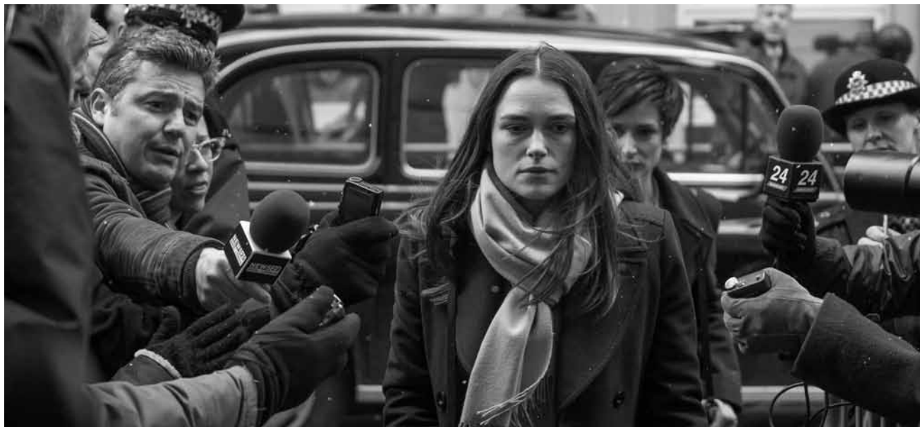
Die Whistleblowerin hinter der Aufdeckung der Lügen, die zum Irak-Krieg führten: Keira Knightley ist Katharine Gun in „Official Secrets“, neu im Utopia.

who lives in a small house near the dunes. Jonathan is determined to become a different, better man. But even if he strictly obeys the rules, his good intentions are soon put to the test when a young girl comes to live next to him.