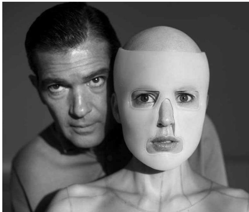
Einer von Almodovars beängstigten Werken: „La Piel que habito“ – an diesem Freitag, dem 7. Februar in der Cinémathèque.

Checker Tobi unternimmt eine Abenteuerreise, die in rund um die Welt führt. Er will das Rätsel um den wichtigsten Rohstoff des Planeten ergründen. Das Wasser spielt die Hauptrolle in dem Dokumentarfilm.