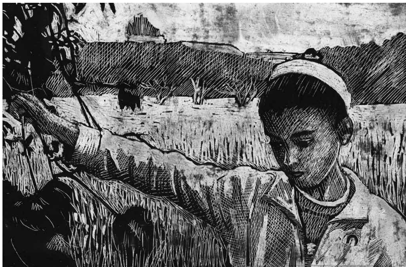
Un documentaire sur la perte de l'identité dans la guerre sans fin à Gaza : « Samouni Road » - projection suivie d'un débat le 12 février à la Cinémathèque.

Dans la périphérie rurale de la ville de Gaza, la famille Samouni s'apprête à