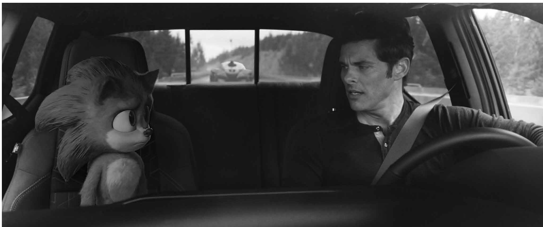
Das pubertierende Powerpaket, das wegen seiner Kräfte in Schallgeschwindigkeit über den ganzen Planeten gejagt wird: „Sonic the Hedgehog“ – neu in fast alle Sälen.

Nachdem sich Königin Elsa nicht nur ihren Ängsten, sondern auch der Öffentlichkeit stellte, kehrte in Arendelle endlich Ruhe ein. Doch die währt nicht lange. Als Elsa eines Tages nämlich eine geheimnisvolle Stimme aus dem Wald zu rufen scheint, verspürt sie einen unbändigen Drang, dieser nachzugehen, in der Hoffnung, Antworten auf Fragen zu finden, die ihr nach wie vor Rätsel aufgeben.