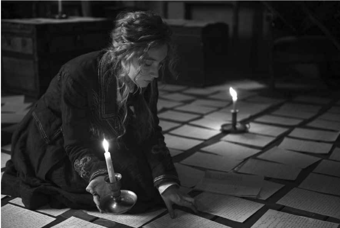
Jo (Saoirse Ronan) will Schriftstellerin sein und unabhängig bleiben.