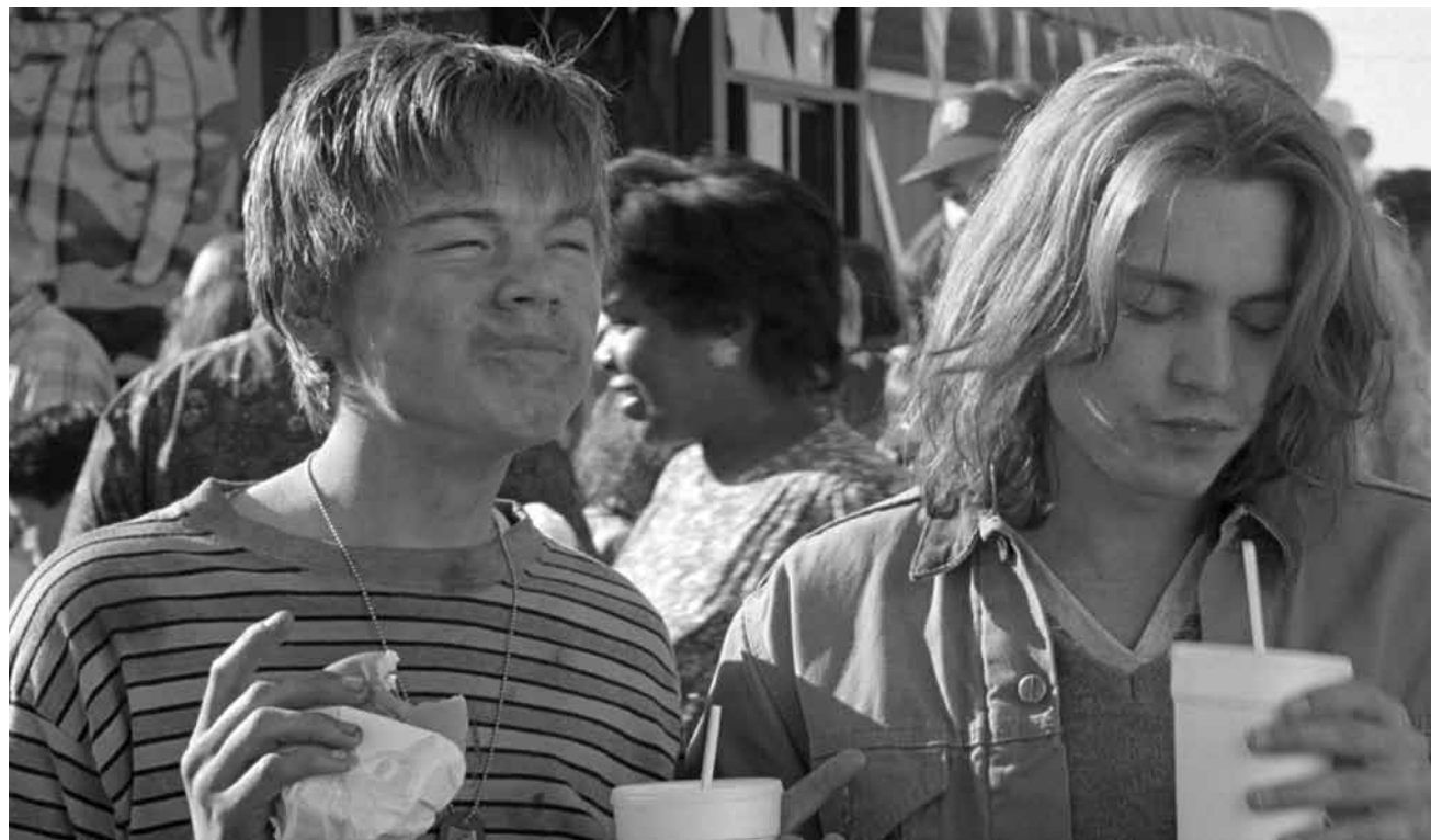
Als Leo und Johnny noch frisch und unverbraucht waren: „What's Eating Gilbert Grape?“ – an diesem Samstag, dem 22. Februar in der Cinémathèque.

USA 1998 von Terry Gilliam. Mit Johnny Depp, Benicio del Toro und Tobey Maguire. 118'. O.-Ton + fr. Ut.