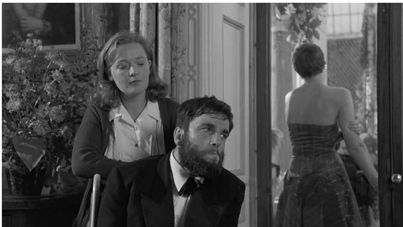
Die Rolle, die Daniel Day Lewis zum Weltruhm verhalf: „My Left Foot: The Story of Christy Brown“ – am 28. Februar in der Cinémathèque.