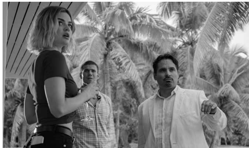
Wenn das Urlaubsprogramm mal wieder nicht hält, was es verspricht: „Fantasy Island“ – neu im Kinepolis Kirchberg.

Draufgänger Mike Lowrey und sein Partner Marcus Burnett stehen immer noch im Dienst der Polizei und treiben Captain Howard nach wie vor mit ihren Missionen, die in Destruktionsorgien enden, zur Weißglut. Nachdem Mike eines Tages Ziel eines Attentats wird, bleibt den beiden nichts anderes übrig, als Jagd auf dessen Angreifer zu machen, der ein dunkles Geheimnis birgt und alles in seiner Macht stehende tut, um die Befehle seiner Mutter erfolgreich auszuführen. Und die will vor allem eines: den Tod von Mike Lowrey.