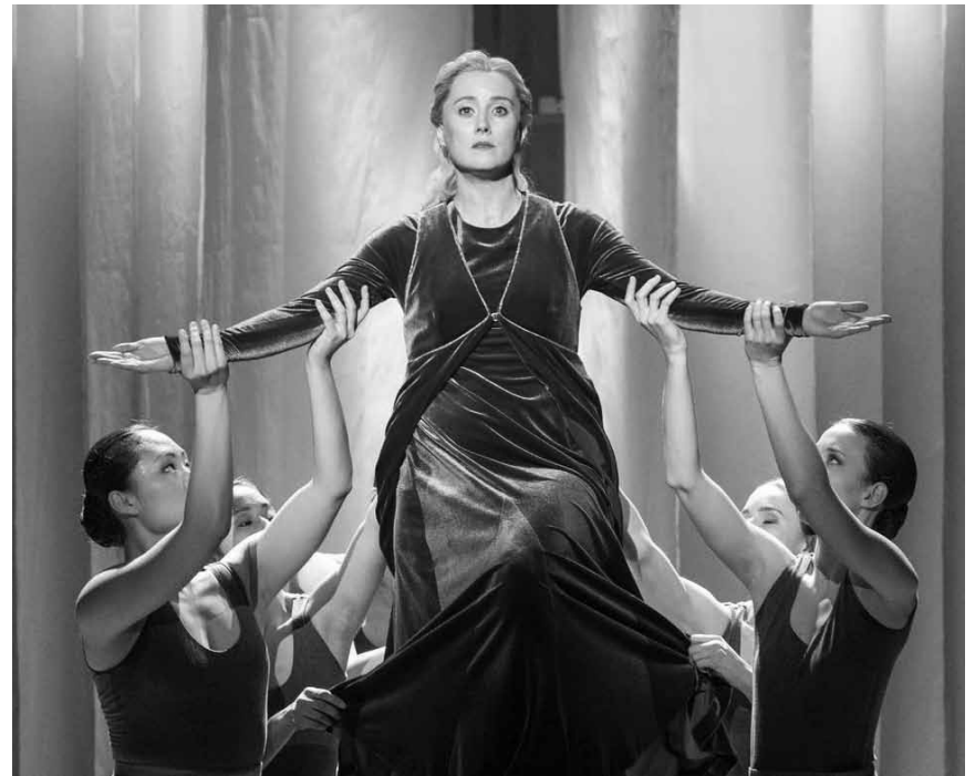
Sprachlos und voller Zukunftsangst – das sind „Ein Brief“ und „Christus am Ölberge“.

Durch die Schließung sämtlicher öffentlicher und privater Kulturinstitutionen, fällt das kulturelle Leben derzeit flach, oder besser gesagt: Es findet im Internet statt. Wir begeben uns wöchentlich für Sie auf die Suche nach den spannendsten Live-Streams, Online-Ausstellungen, Serien und Filmen. In der aktuellen Ausgabe gibt es außerdem ein paar neue Empfehlungen zum Zocken. Wir wünschen Ihnen viel Spaß beim Lesen, Anschauen und Musikhören.