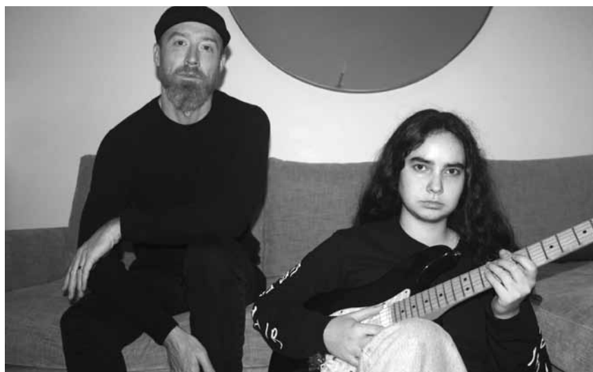
„Francis of Delirium“ spielen an diesem Freitag, dem 6. Mai bei ihrer Crazy Quarantine Session gegen den Lockdown-Blues an.

Der feurige Engel, von Sergej Prokofjew, unter der Leitung von Michail Jurowski, inszeniert von Barrie Kosky, Bayerische Staatsoper, 8h. www.staatsoper.de Aufzeichnung verfügbar bis zum 9.5. um 12h.