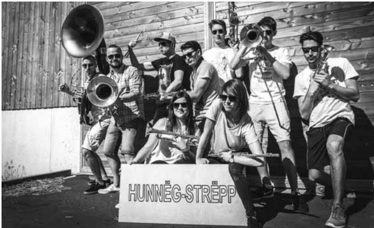
Hunneg-Strépp : l'ensemble à vents sans uniformes, mais avec des idées !