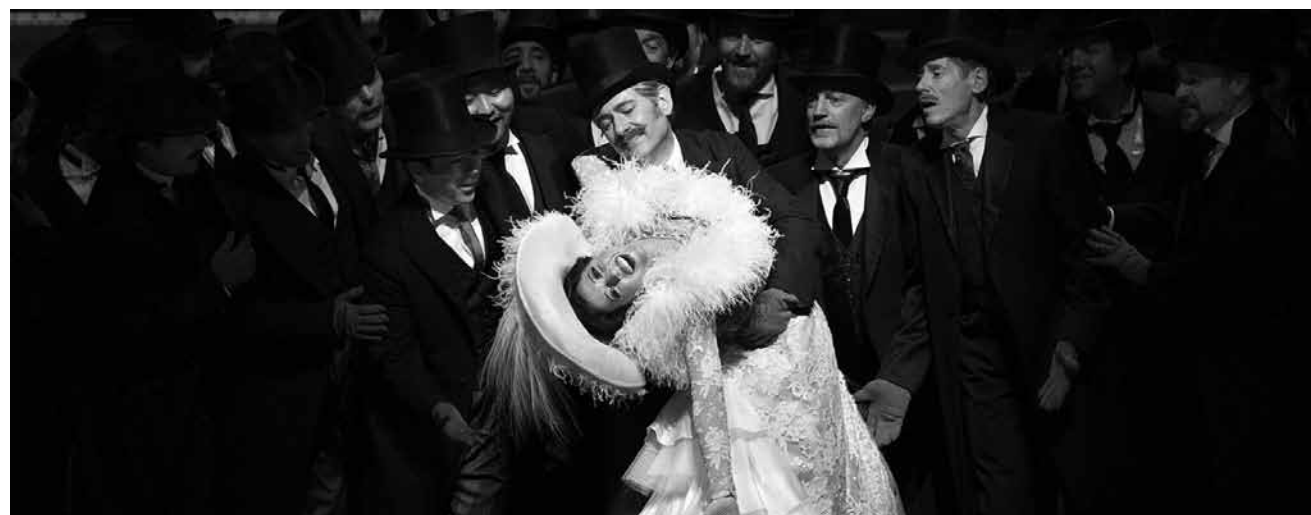
Es wird pompös in der Metropolitan Opera: Manon läuft an diesem Freitag, dem 26. Juni, um 0.30 Uhr, auf metopera.org.

Fingertips ASBL, The Goldberg variations played by 32 pianists (from around the world!). One video (= one variation) will be published every day until the work is complete, www.facebook.com/projectfingertips