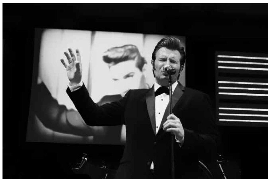
Elvis durchbricht am 1. Juli, um 20 Uhr, die Dimensionen - und zwar in „The Multimedial Experience“ in der Pétenger Carena.