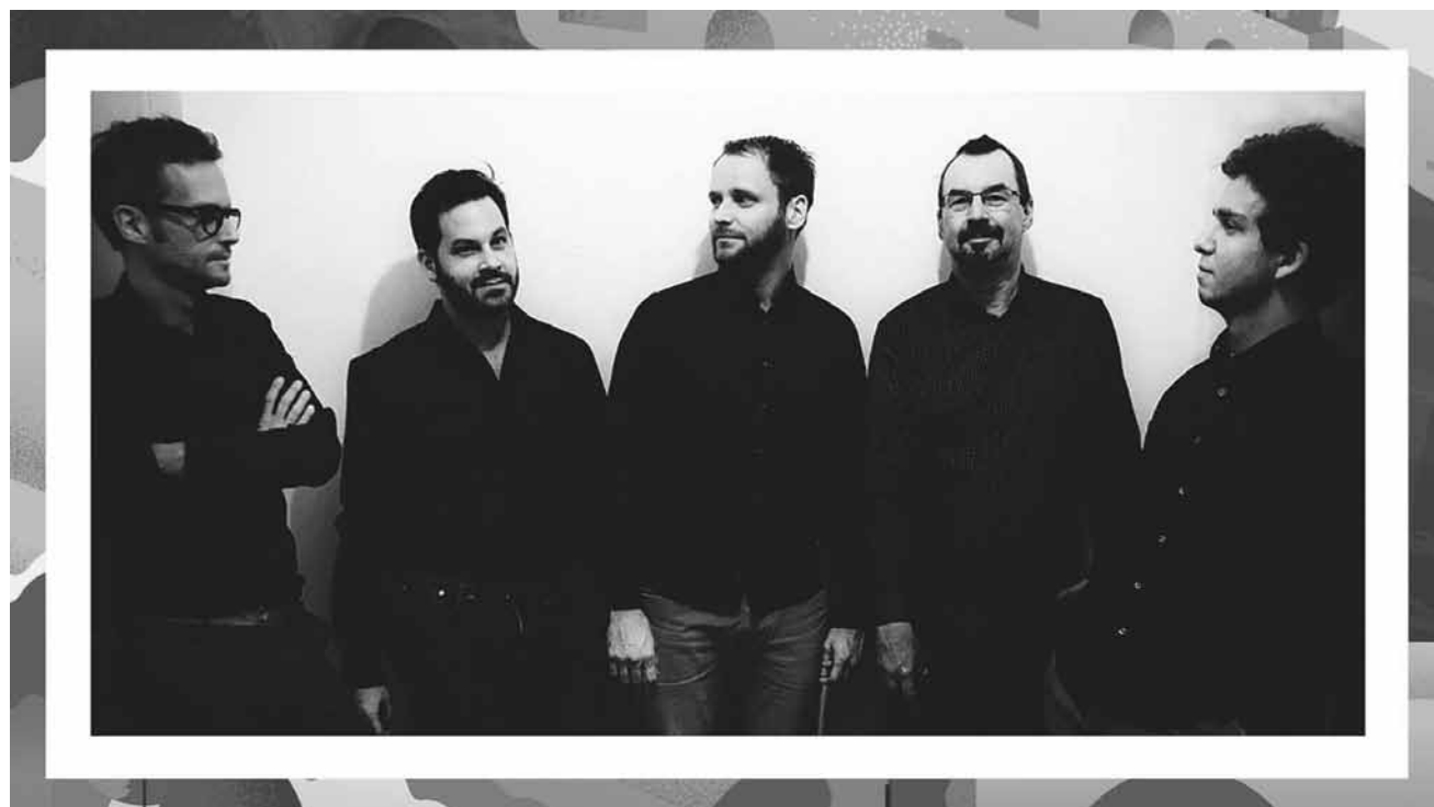
The Minor Majors joueront du jazz sur le parvis de Neimënster, ce dimanche 12 juillet à 11h.

Rosas im Fokus der Kamera , Berliner Festspiele, www.berlinerfestspiele.de/de/berliner-