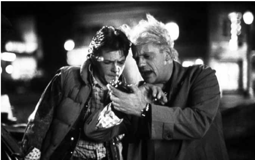
„Back to the future“ ist zu Corona-Zeiten sicherlich ein beliebtes Reiseziel – Abfahrt am 1. August, um 21h30, im Kino um Glacis.

OPEN AIR | 24.07. - 02.08. / KINO | 24.07. - 28.07.