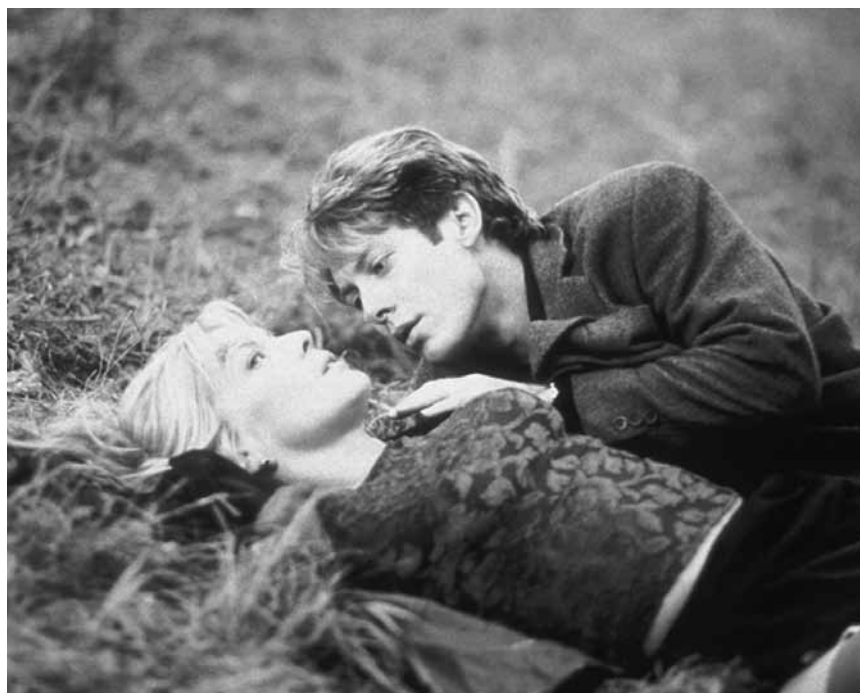
Zusammen gestoßen und hingefallen? „Crash“ läuft im Utopia und erzählt von der Entfremdung zwischen James Ballard und seiner Frau Catherine.

I Will Cross Tomorrow Interstellar Lassie - Eine abenteuerliche Reise Meine Freundin Conni - Geheimnis um Kater Mau Moj dida je pao s Marsa Om det oändliga Onward Pinocchio Takeover - voll vertauscht Undine