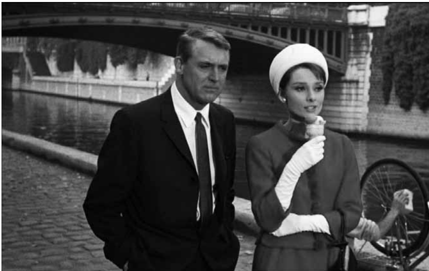
Was Audrey Hepburn in „Charade“ vom Eis essen abhält, wird am 27. Juli, um 20h30, in der Cinémathèque verraten.

CINÉMATHÈQUE / CINÈMA DU SUD | 24.07. - 02.08.