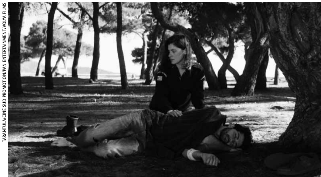
TARANTULACINE SUD PROMOTION/PAN ENTERTAINMENT/VOIVA FILMS

Brève rencontre improbable sur l'île de Lesbos : policière et réfugié partagent un moment d'intimité.