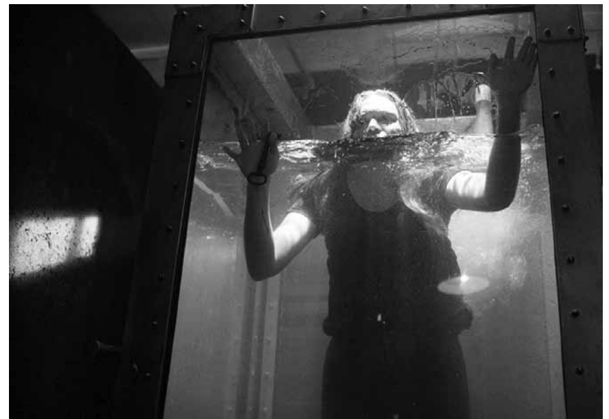
Influencer*innen tauchen unter: „Follow Me“, im Kinepolis Kirchberg und Belval, gehen mit extremen Aktionen auf Anhänger*innen-Fang.

Jeanne, une jeune femme timide, travaille comme gardienne de nuit dans un parc d'attractions. Elle vit une relation fusionnelle avec sa