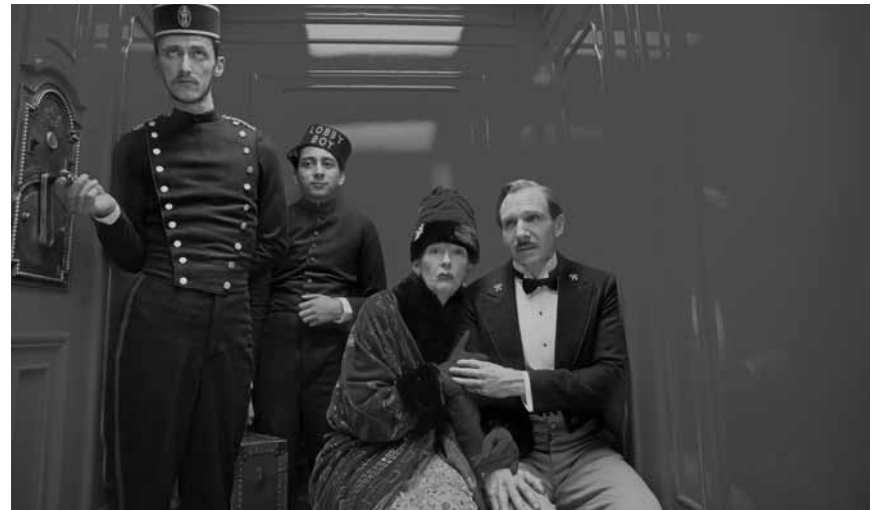
Von wegen „Vakanz doheem“: Die regionalen Säle laden ins „The Grand Budapest Hotel“ ein – Gutscheine vom Tourismusministerium nicht vergessen!

Geppetto vient de terminer sa dernière œuvre : une marionnette en bois. À sa grande surprise, celle-ci s'anime, commence à parler, courir et manger. N'ayant jamais eu d'enfants, Geppetto l'appelle Pinocchio et décide de l'élever comme son fils. Mais Pinocchio se révèle être assez turbulent vivra de nombreuses mésaventures, entraînant parfois Geppetto avec lui. Pinocchio sera trompé, kidnappé et poursuivi par des bandits à travers un monde