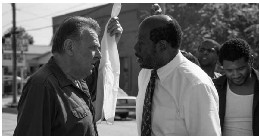
„Burden“, oder wie eine schwarze Kirchengemeinde ein Ex-Mitglied des Klu-Kux-Klans das Lieben lehrt – zu sehen im Kinopolis Kirchberg.

Nachdem sich Königin Elsa nicht nur ihren Ängsten, sondern auch der Öffentlichkeit stellte, kehrte in Arendelle endlich Ruhe ein. Doch die währt nicht lange. Als Elsa eines Tages meint eine geheimnisvolle Stimme aus dem Wald rufen zu hören, verspürt sie einen unbändigen Drang, dieser nachzugehen, in der Hoffnung, Antworten auf Fragen zu finden, die ihr nach wie vor Rätsel aufgeben.