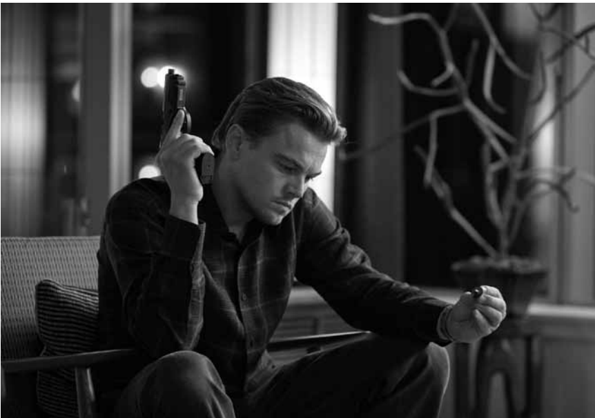
Bereit mit Leonardo Di Caprio um die Wette zu träumen? „Inception“ läuft an diesem Freitag, dem 31. Juli, um 22h, im Open Air Mondorf.

Luxembourg-ville Kinopolis Kirchberg Utopia (pour les réservations du soir : tél. 22 46 11)