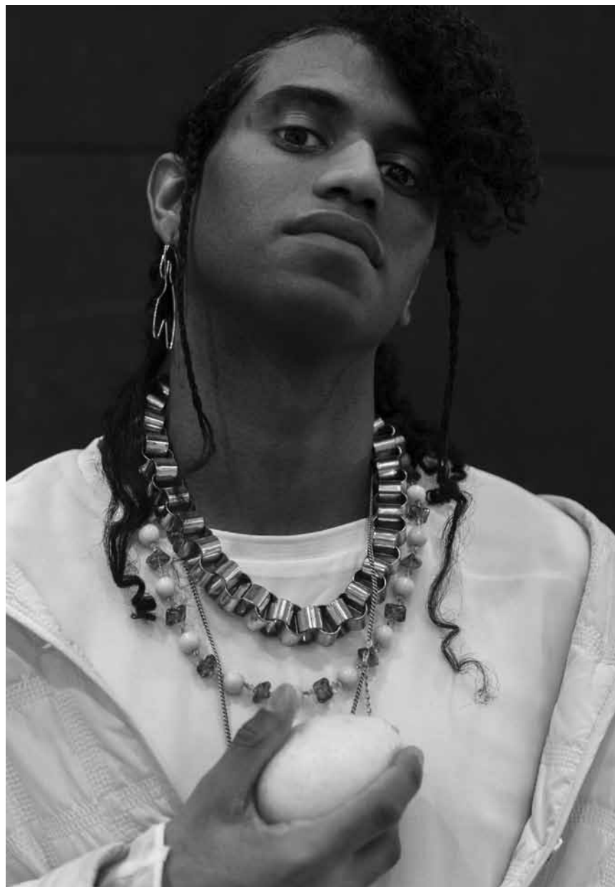
Edsun trägt die Sonne im Namen - und präsentiert an diesem Samstag, dem 22. August, um 20 Uhr seinen Elektro-Pop in den Rotondes, zusammen mit Aamar.

The Water Fight Luxembourg, Rives de Clausen, Luxembourg ,