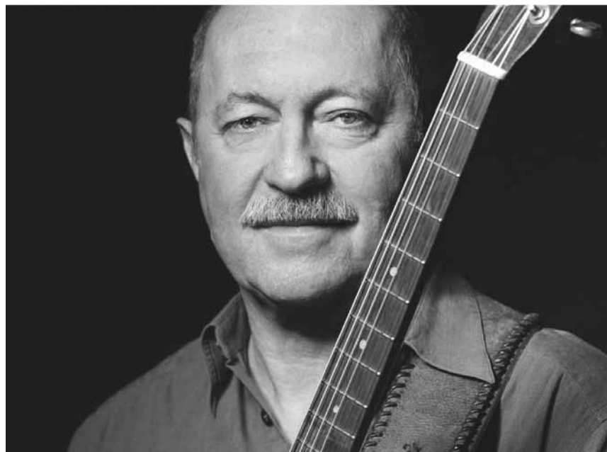
Musikalischer Brunch mit dem Sammy Vomáčka Trio auf dem Vorplatz der Abtei Neumünster- am 30. August, ab 11h.

The Bucket List , Vorführung des Films von Rob Reiner (USA 2007. 97'. Dt. Fassung), Tufa Innenhof, Trier (D) , 20h30. Tel. 0049 651 7 18 24 12. www.tufa-trier.de