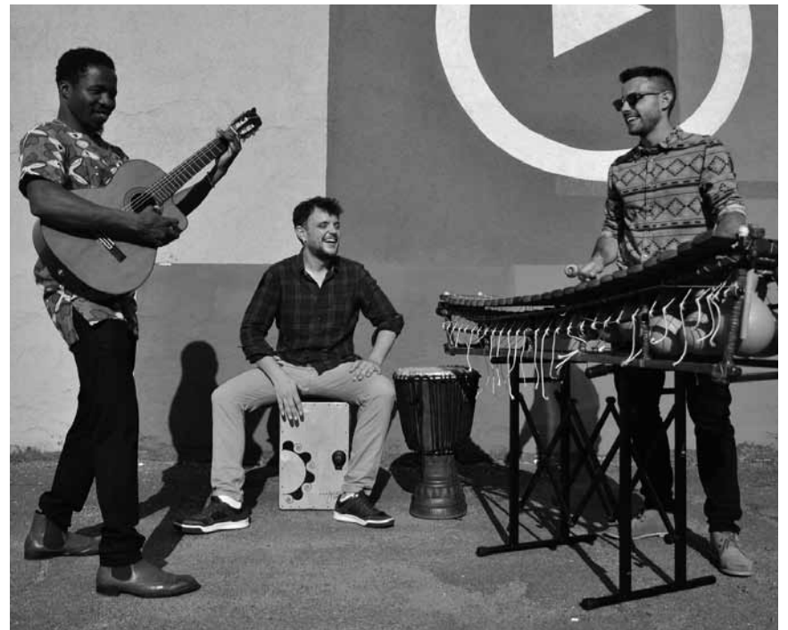
Tribubu spielt ihre vielseitige Mischung aus Rumba, Folk, Blues und afrikanischem Beat an diesem Freitag, dem 21. August um 19h30 in der Tufa Trier.