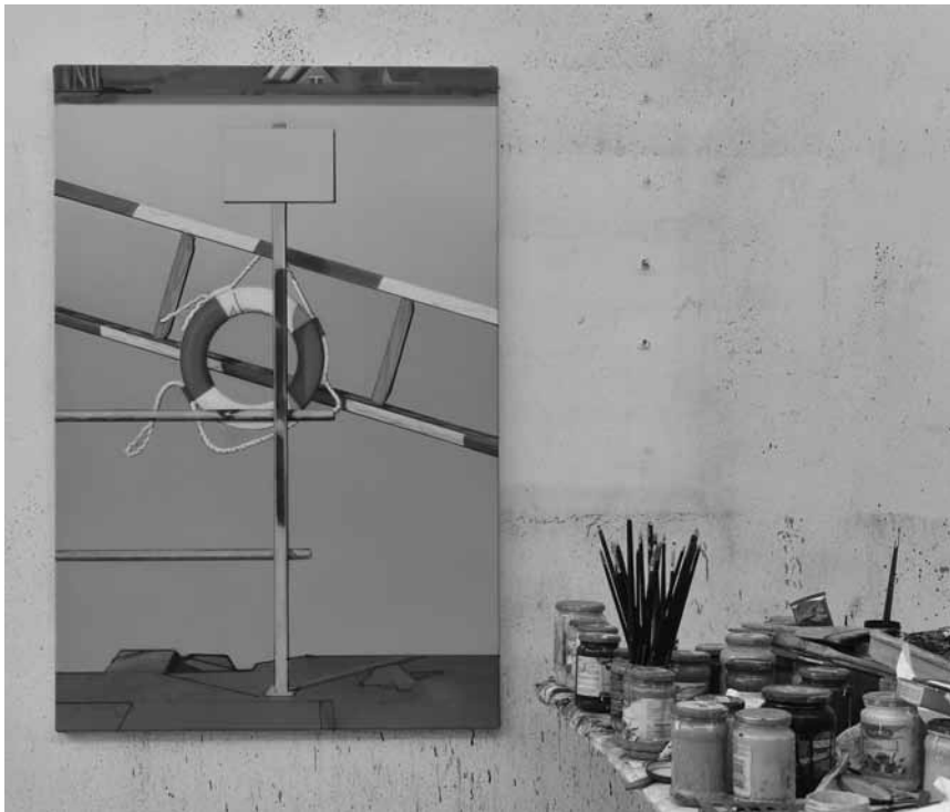
Thoralf Knobloch zeigt in „Fundbüro“ seine Malerei im Kunstverein Junge Kunst in Trier: vom 3. Oktober bis zum 14. November.

Tel. 45 37 85-1), bis zum 7.2.2021, Do. - Mo. 10h - 18h, Mi. 10h - 22h (Galerie) oder 23h (Café).