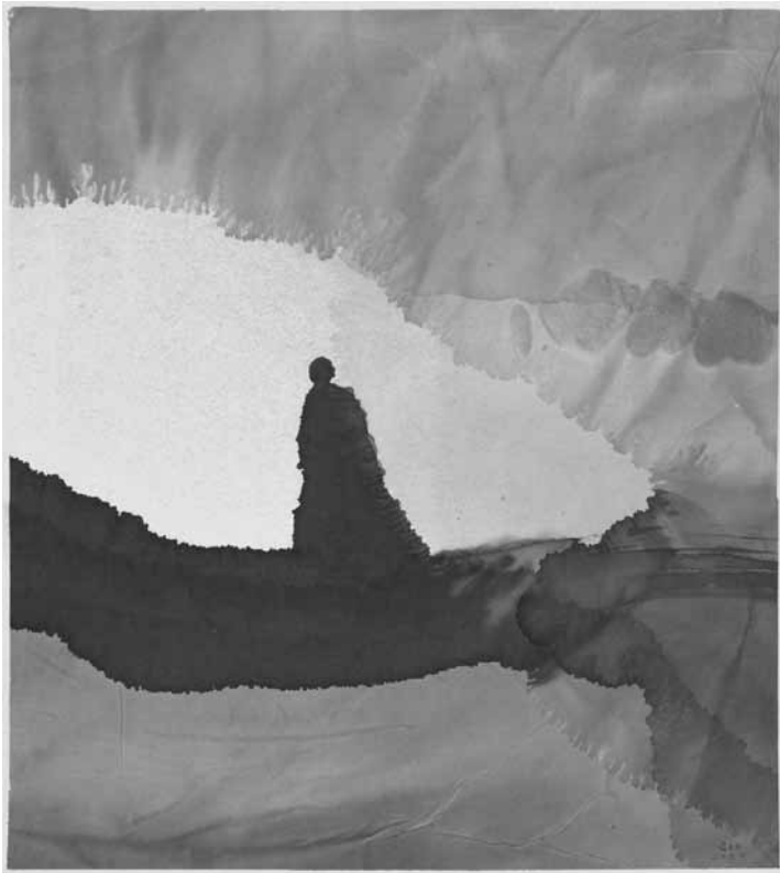
Gao Xingjian, « Le marcheur », 2020