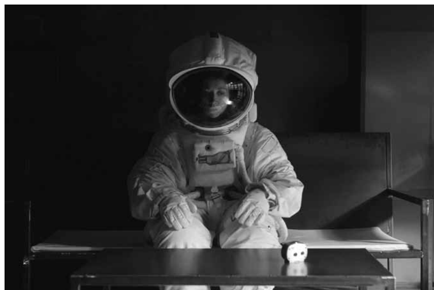
Éva n'est pas une astronaute - elle est tout simplement allergique à tout : « Eden », à la Cinémathèque le 20 octobre à 18h.