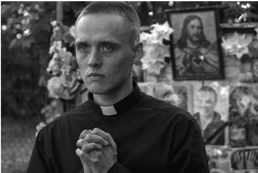
Daniel est un ancien détenu qui veut devenir prêtre - « Boze Cialo » parle de son combat avec la vérité, à voir à l'Utopia.

La page woxx.lu/kino vous dira exactement où et quand trouver la prochaine séance !