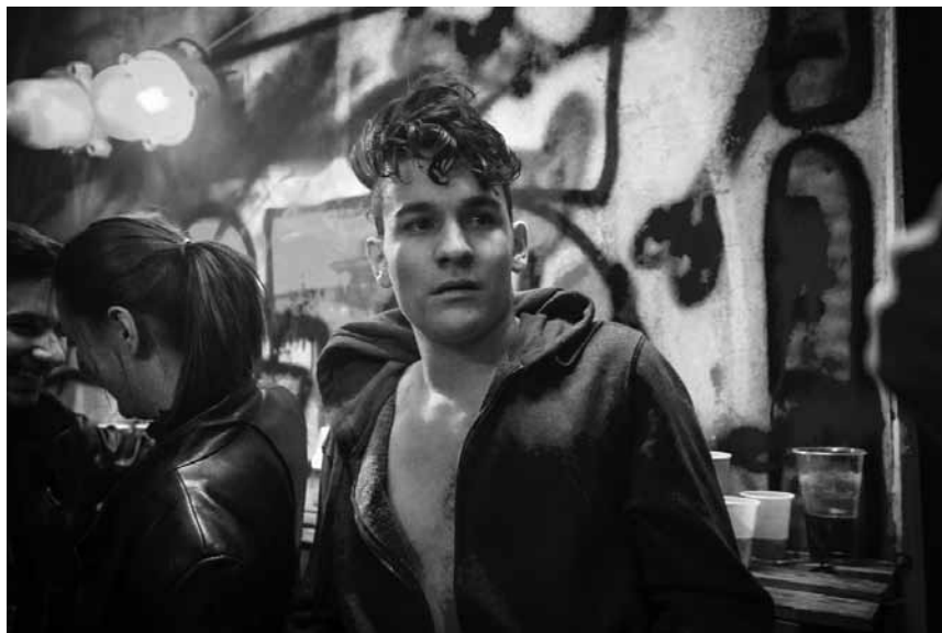
Un jeune punk, un suicide et les services sociaux ? Tout se rejoint dans « Otto Barbarul », le 16 octobre à la Cinémathèque, dans le cadre du festival CinEast.

(Nothing Is Lost) PL 2019 de Kalina Alabrudzinska. Avec Zuzanna Pulawska, Michal Surosz et Piotr Pacek. 71'. V.o. + s.-t. ang.