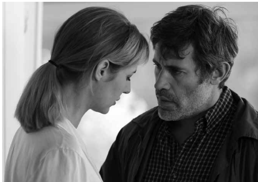
« L'enfant rêvé » parle du désir d'enfant couplé à l'adultère - nouveau à l'Utopia.